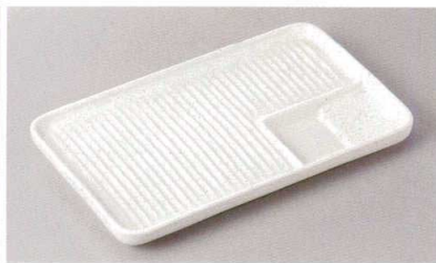
267-9-43H 1,200円 ヘルシー長角皿(中)白 21.7×12.3×2cm