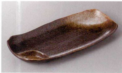
267-4-31H 1,500円 黒水晶仕切レレー 33.7×15×4.3cm