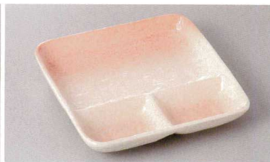
267-6-77H 1,300円 桜志野三つ仕切正角皿 18×17×3cm