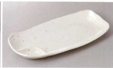
267-3-31H 1,500円 白粉引仕切レレー 33.7×15×4.3cm