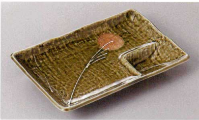
267-14-23H 1,200円 織部ススキ仕切皿 21×13cm