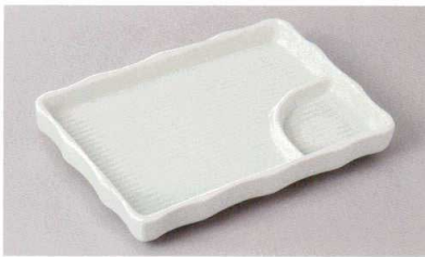
267-8-21H 1,300円 青地カゴメ仕切皿 18.8×13×2.8cm