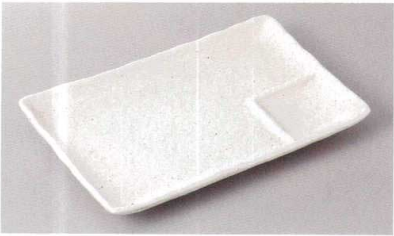
267-13-35H 1,100円 白梨地仕切付焼物皿 22.3×14.4×2.5cm