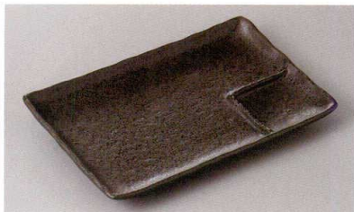
267-12-35H 1,100円 黒水晶仕切付焼物皿 22.3×14.4×2.5cm