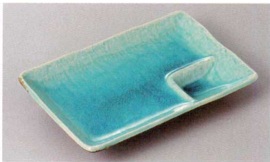
267-15-23H 1,180円 ヒスイ仕切皿 21×13.5cm