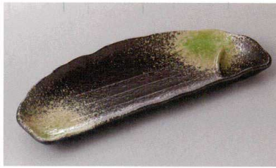
267-2-21H 1,600円 磯辺寿司皿 30.8×12×3cm