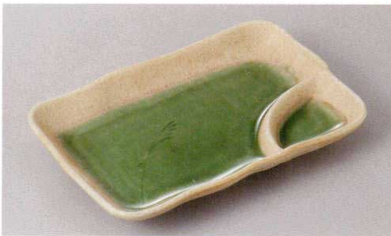
267-11-60H 1,190円 石焼フリット仕切皿 21×12.5cm