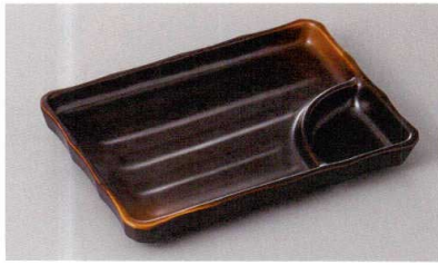
267-1-77H 1,500円 焼締め7.0寸長角仕切皿 19×13.2×2.5cm