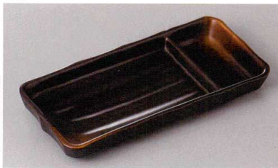
267-5-77H 1,320円 焼締め突出仕切皿 20.6×9.5×2.2cm