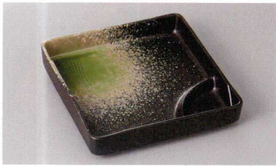
267-7-23H 1,430円 ヒワ吹正四角仕切鉢 16.6×3.2cm