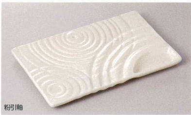
267-20-57H 1,050円 波紋仕切付焼物皿 21.2×13.4×1.5cm