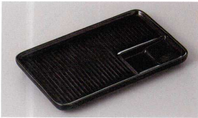
267-10-43H 1,200円 ヘルシー長角皿(中)黒 21.7×12.3×2cm