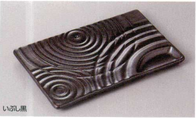
267-16-57H 1,050円 波紋仕切付焼物皿 21.2×13.4×1.5cm