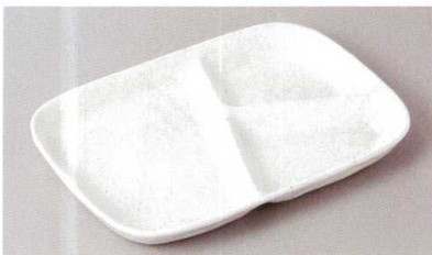
269-10-78H 680円 粉引仕切皿 23×15.2×2.5cm