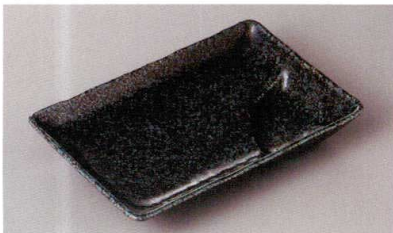
269-7-79H 700円 黒青釉6.0長角仕切皿 17.5×11.5×2.7cm