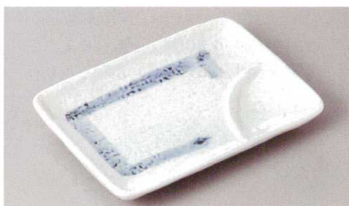
269-14-71H 600円 オフケ6.0仕切皿 17.5×12×2cm