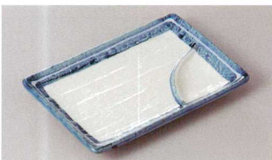
269-13-79H 600円 一珍ゴスライン6.0仕切皿 17.3×11.3×2cm