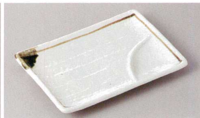
269-12-79H 600円 志野茶ライン6.0仕切皿 17×11.3cm