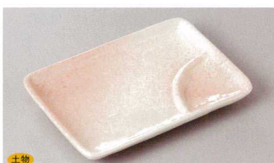
土物 269-17-79H 600円 桜志野6.0仕切皿 18×12.3cm