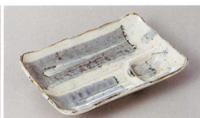
269-18-23H 650円 藍染仕切付サシミ皿小 16.7×11.2×2.7cm