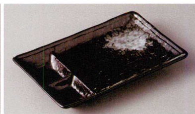
269-15-78H 700円 天目ソカンツ皿 21.2×13.5×2.6cm