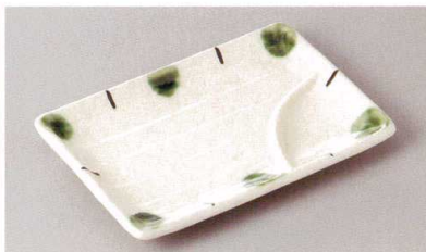
269-11-79H 600円 測織部十草6.0仕切皿 17.3×11.3cm