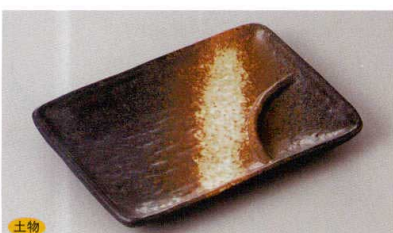
土物 269-16-79H 600円 黒備前6.0仕切皿 17.5×12×2cm