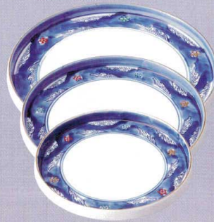
659-19-22H 4,600円 切立丸皿(大) 24×2cm