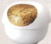
659-60-22H 3,200円 玉蒸し碗 9.5×8.5cm 220cc