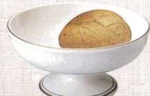
659-55-22H 4,300円 丸高台刺身鉢 15.5×7.8cm