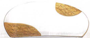
659-51-22H 4,300円 半月天皿 23.7×17.5×3cm