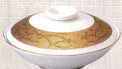
659-59-22H 4,300円 新平蓋向付(小) 15.8×7.5cm