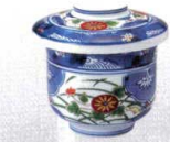
659-1-22H 2,950円 蒸し碗 8.3×9.3cm 200cc