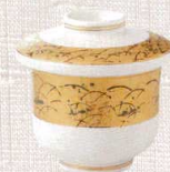
659-61-22H 3,500円 新型むし碗 8.4×9.1cm 220cc