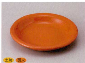
859-21-86H 1,300円 三河柳川鍋半人用 16×3cm