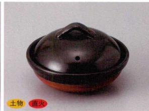
859-7-81H 2,900円 黒釉4.5号蓋物鍋 14.5×9.5cm