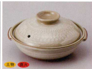
859-8-81H 2,500円 京三島5.5号鍋 18.5×17×9cm