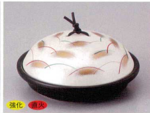
859-6-77H 4,500円 黒釉銀彩武蔵野陶板 17×7cm 蓋:強化