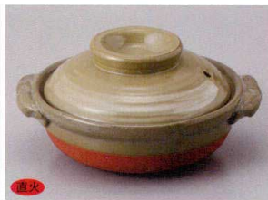
859-10-84H 4,150円 京風白刷毛目5号鍋 19.5×17×10cm 859-11-84H 3,200円 京風白刷毛目5号鍋 11.5×15.5×8.3cm