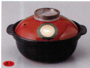
859-14-84H 4,300円 朱巻金紋5号鍋 17×15×9.5cm