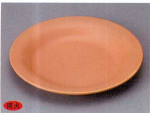
859-22-84H 2,200円 茶柳川皿(大) 20.2×2.5cm