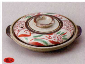
859-13-84H 4,150円 間取赤絵柳川鍋 19.3×17.2×6cm