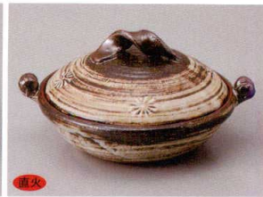
859-4-84H 3,100円 刷毛目印花紋5号鍋 19×15.5×9cm