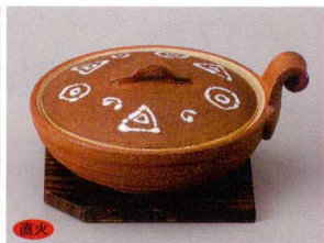
859-17-71H 3,800円 白盛渦目玉焼(板付) 14×11.5×5.6cm 110cc 耐熱