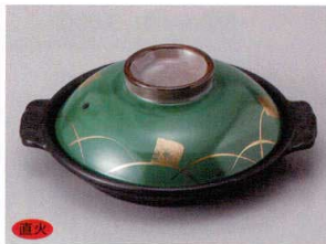
859-15-84H 5,700円 グリーン金紋6号陶板 19.5×23×8.3cm