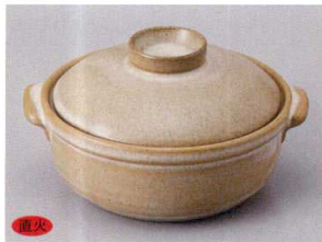
859-9-84H 2,900円 茶4号鍋 14.7×13×8cm