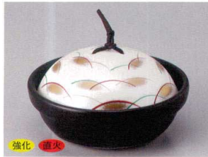
859-5-77H 4,050円 黒釉銀彩武蔵野耐熱鍋 16×8cm 蓋:強化