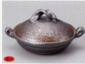
859-2-84H 3,100円 窯変鉄釉5号鍋 19×15.5×9cm