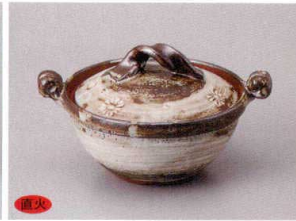
859-3-84H 2,900円 刷毛目印花紋4号鍋 15.2×12.3×9.5cm