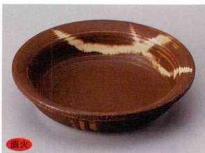
859-23-71H 2,700円 黄瀬戸柳川鍋 16.7×3.8cm 耐熱