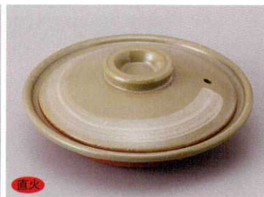
859-12-84H 3,800円 京風白刷毛目柳川鍋 17.3×6.5cm