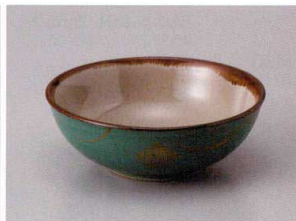
859-16-84H 1,000円 グリーン金紋小鉢 12.7×4.5cm