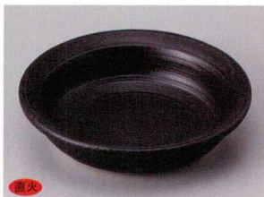
859-19-71H 2,700円 黒柳川鍋 16.7×3.8cm 耐熱