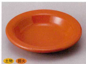
859-20-86H 1,400円 三河柳川鍋1人用 20×3cm