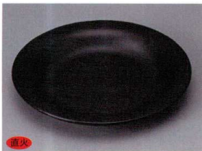
859-18-84H 2,200円 黒柳川皿(大) 20.2×2.5cm