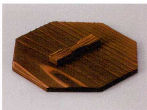
859-26-84H 1,450円 柳川用木蓋(大) 18.8×18.8cm 859-27-84H 1,150円 柳川用木蓋(小) 15×15cm