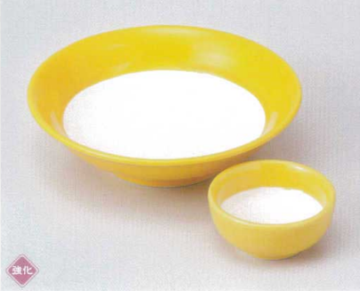
強化 10-201-742 2,430円 黄白刺身鉢(15.8×4.3) 801040574 10-202-742 840円 黄白丸千代口(6.9×3.2) 801040674