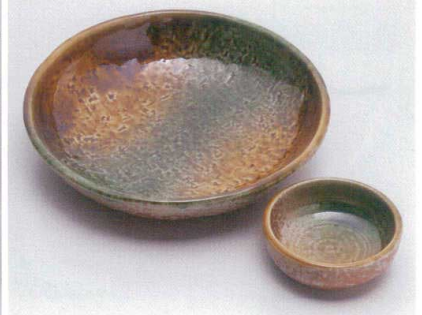
10-305-742 2,150円 黄瀬戸織部刺身鉢(16.4×3.4) 1001940574 10-306-742 900円 黄瀬戸織部丸千代口(6.7×2.5) 1001940674