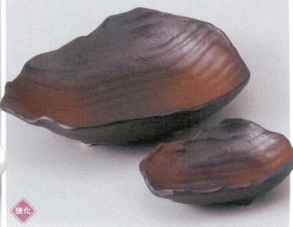
強化 10-405-782 2,050円 火色岩型刺身鉢(19.5×14×4.5) 1001830778 10-406-782 810円 火色岩型千代口(11×8×3) 1001830878