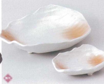
強化 10-403-702 2,050円 あけぼの岩型刺身鉢(19.5×14×4.5) 1001830570 10-404-702 810円 あけぼの岩型千代口(11×8×3) 1001830670