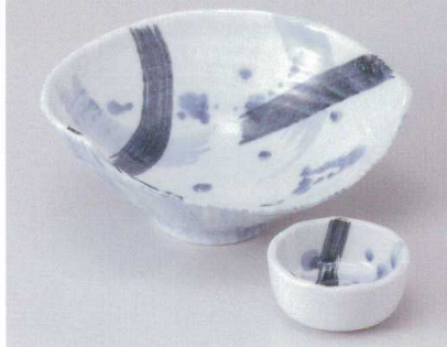
10-303-302 2,150円 呉須散し片切向付(16×14.8×7.5) 502440530 10-304-302 800円 呉須散し千代口(6.8×3.2) 502440630