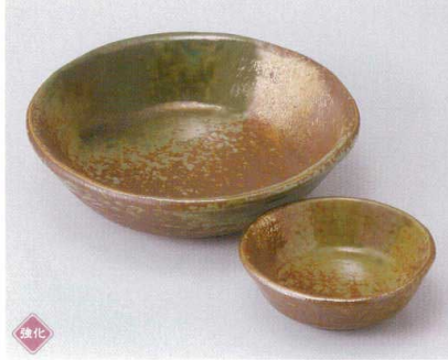
強化 10-203-742 2,450円 金彩吹織部丸刺身鉢(15.5×4) 502330174 10-204-742 1,150円 金彩吹織部丸千代口(8.8×2.8) 502330274