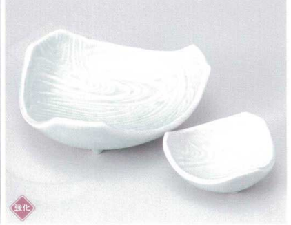
強化 10-205-702 2,200円 青白磁流水向付(14.8×5.8) 1101040170 10-206-702 700円 青白磁流水千代口(8.3×3.2) 1101040270