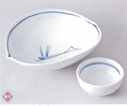
強化 10-101-782 2,640円 魚画楕円向付(16.3×13.6×5.3) 601440578 10-102-782 790円 呉須一筆丸千代口(6.8×3) 601440678