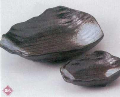
強化 10-401-742 2,050円 白吹黒水晶岩型刺身鉢(19.5×14×4.5) 1001830374 10-402-742 810円 白吹黒水晶岩型千代口(11×8×3) 1001830474