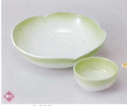
強化 10-103-742 2,590円 ヒワ吹花型刺身鉢(15.2×14.8×4) 502330577 10-104-742 790円 ヒワ吹丸千代口(6.7×3) 502330677