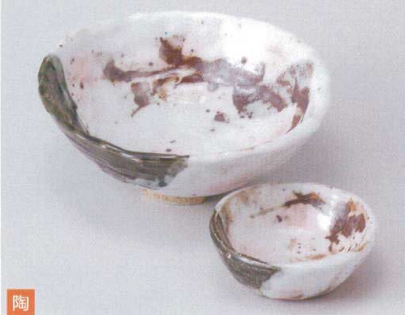
陶 10-301-302 2,250円 織部古木刺身鉢(15×6) 502430530 10-302-302 1,300円 織部古木千代口(8.2×2.8) 502430630