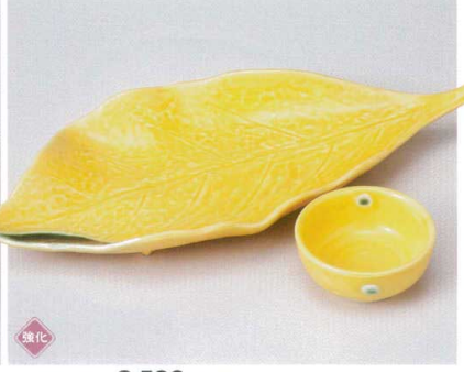
強化 10-105-742 2,590円 黄輝葉型刺身鉢(28.5×12.2×3.3) 502310174 10-106-742 790円 黄輝丸千代口(7×3) 502310274