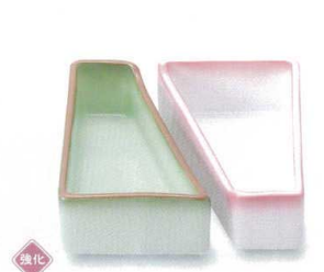
強化 100-406-702 1,020円 緑彩台形鉢(10.2×6.7×4) 516420171 100-407-702 1,020円 ピンク吹台形鉢(10.2×6.7×4) 516420271