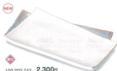
NEW 強化 100-202-742 2,300円 黄地金彩折紙長皿 (22.5×11.5×2.3) 1210020274