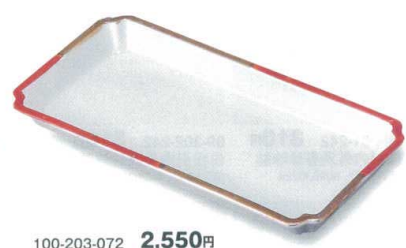
強化 100-203-072 2,550円 赤金長角鉢 (23×11.5×2.5) 512220407