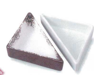
強化 100-402-702 1,030円 鉄仙花白吹三角松花堂(15.3×10.8×2.9) 1110150270 100-403-702 980円 青白磁三角松花堂(15.3×10.8×2.9) 1110150370