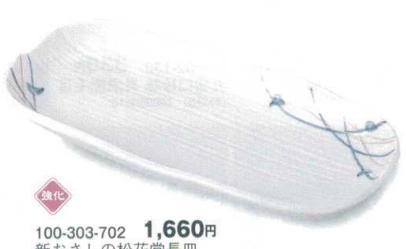
強化 100-303-702 1,660円 新むさしの松花堂長皿 (22.3×11×2.5) 516560371