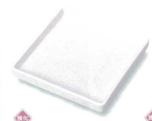
強化 100-401-262 1,350円 パール四角蓋 (10.3×10.3×1.6) 817040226