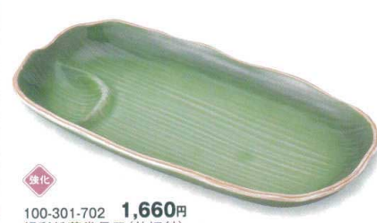
強化 100-301-702 1,660円 緑彩松花堂長皿(仕切付) (23×11.3×2.5) 516560477