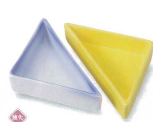
強化 100-404-742 1,030円 吹付ルリ三角松花堂(15.3×10.8×2.9) 1110150474 100-405-742 980円 レモン三角松花堂(15.3×10.8×2.9) 1110150574