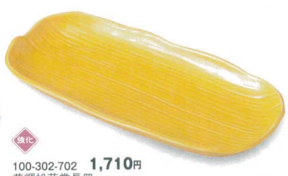
強化 100-302-702 1,710円 黄輝松花堂長皿 (22.3×11×2.5) 1018030670