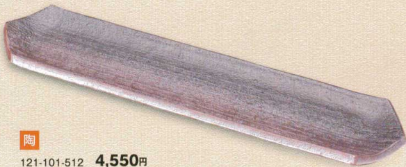
陶 121-101-512 4,550円 備前風六角長皿(39.5×9) 511030151