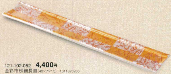
121-102-052 4,400円 金彩市松細長皿(40×7×1.5) 1011820205