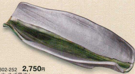
121-302-252 2,750円 葉月中 ゆず黒流し(28.5×11.4×3.5) 1112130125