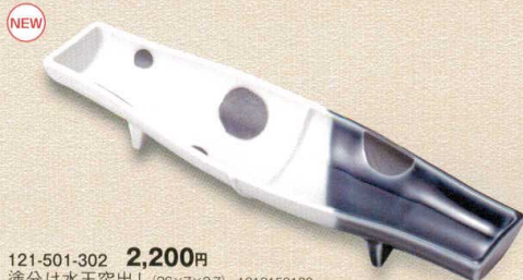
NEW 121-501-302 2,200円 塗分け水玉突出し(26×7×3.7) 1212150130