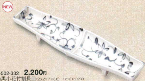
NEW 121-502-332 2,200円 安南黒小花竹割長皿(26.2×7×3.6) 1212150233