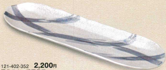
121-402-352 2,200円 黒ラスター楕円長皿(35.4×9.7×2.3) 1112140135