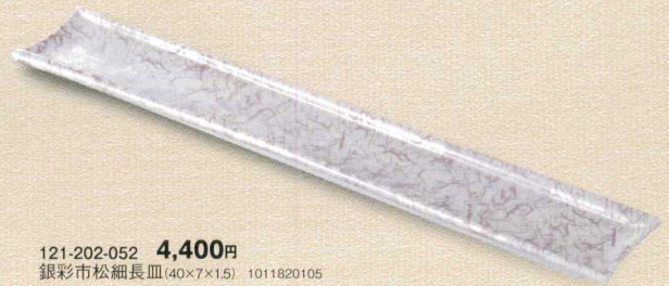
121-202-052 4,400円 銀彩市松細長皿(40×7×1.5) 1011820105