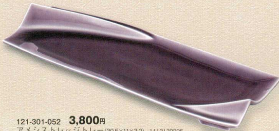
121-301-052 3,800円 アメシストレッジトレイ(30.5×11×3.2) 1112130205