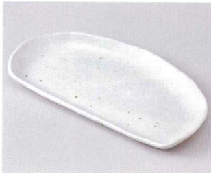
141-301-162 930円 白均窯半月焼きもの皿 (21.5×12.6×2.2) 544405516