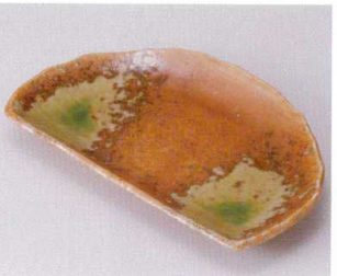
141-504-612 630円 半月皿 伊賀(21×13.2×2) 513150361 141-505-612 520円 半月皿 伊賀小(16.5×10.5×2) 613950361