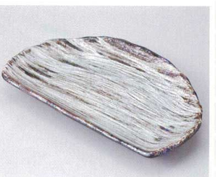
141-304-162 820円 白刷毛半月焼物皿 (20.7×13.4×2.7) 712240216