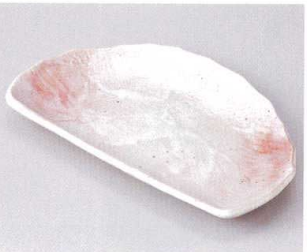
141-402-612 800円 桜志野半月皿 (21×13.2×3) 712240161