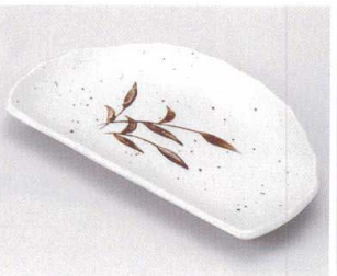
141-403-402 570円 金彩芦 半月皿 (21×13.5×3) 1114140340