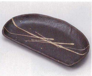
141-302-152 950円 筆流し半月焼物皿茶 (22×13×2) 1114140215