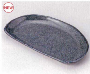
141-201-512 1,350円 黛変紺 半月焼物皿 (22×12.8×1.8) 1214120151