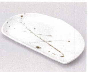
141-303-152 950円 筆流し半月焼物皿白 (22×13×2) 1114140115