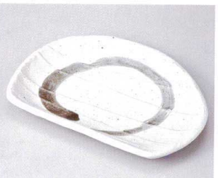
141-104-402 1,090円 粉引うず潮 半月皿 (22.7×16.5×2.5) 712150240