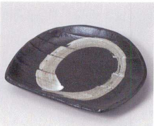
141-103-402 1,090円 油滴うず潮 半月皿 (22.7×16.5×2.5) 613150240