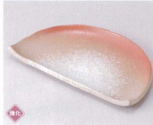
141-101-782 1,800円 雪どけ半月7.0皿 (21.3×12.8×2.2) 512510277