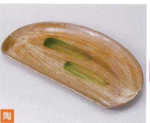
141-204-512 920円 黄瀬戸オリベ半月皿 (24×13.5×1.4) 513110251