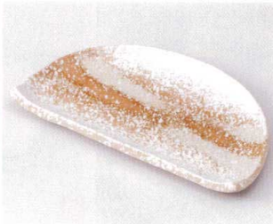
141-102-742 1,550円 白伊賀半月7.0皿 (21×12.5×1.8) 643006674