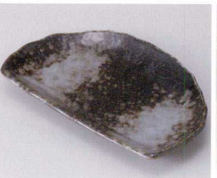
141-506-612 630円 半月皿 天目白吹(21×13.2×2) 513150461 141-507-612 520円 半月皿 天目白吹小(16.5×10.5×2) 613950461