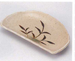
141-404-402 570円 吉野芦 半月皿 (21×13.5×3) 1114140440