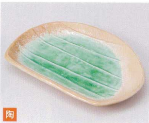
141-202-412 1,080円 白浜若葉 半月皿 (22.8×16.5×2.5) 812730141