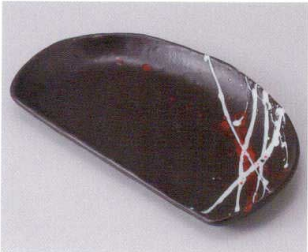
141-401-152 950円 潮 半月焼物皿 (21.7×12.7×2) 513050115