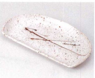
141-203-632 1,100円 乱刷毛 半月皿 (21.4×12.5×2.1) 913840263