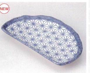
141-508-402 570円 藍染の器 半月皿 (16.5×10.5×2.5) 1214150840