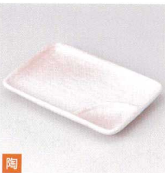
145-303-792 660円 桜志野6.0長角仕切皿 (17.5×12×2.2) 713350179