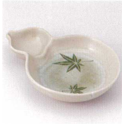
145-101-742 1,620円 ビードロ紅葉ヒサゴ仕切皿 (20.5×16×4.3) 542600474