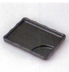
145-305-702 900円 瀬戸黒5.5長角仕切皿 (14×11×2) 1014330570