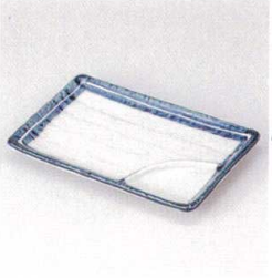
145-403-742 600円 瀏ライン6.0長角仕切皿 (17×11×2) 513850174