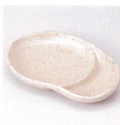
145-205-252 1,100円 うす茶うのふ変形仕切皿 (17.4×12.2×2.6) 713250125