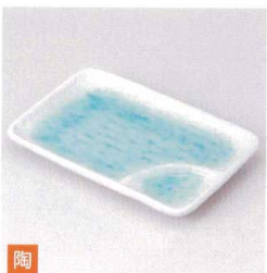
145-304-792 660円 白流水6.0長角仕切皿 (17.5×12×2.2) 513840577