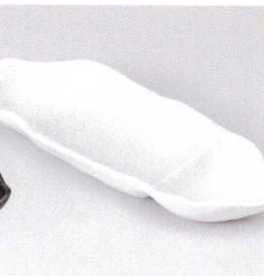
145-505-612 790円 木の葉仕切皿 白 (27×10.5×3.5) 513940261