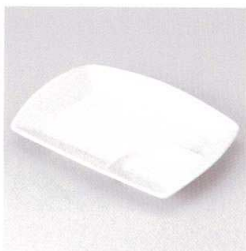
145-203-052 1,150円 白スタックパーティー皿 (18.3×13.9×2.8) 513810505