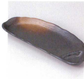
145-201-262 1,300円 黒茶吹半月仕切皿 (28.2×12×2.7) 1014310326