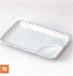
145-402-792 660円 二色十草長角6.0仕切皿 (17.5×12×2.2) 1014250279