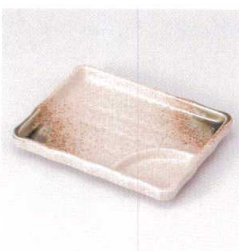
145-204-472 1,150円 伊賀織部5.5長角仕切皿 (14×10.7×1.8) 813950447