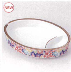
145-103-612 1,600円 藍花舞小判型仕切り鉢 (19×14×4) 1214510361