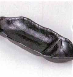
145-504-612 790円 木の葉仕切皿 天目 (27×9.7×4) 614150561