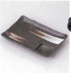
145-503-152 950円 白刷毛天目 仕切串皿 (17×12×2.5) 1014320415