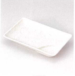
145-401-702 700円 クリーム粉引6.0仕切皿 (17.5×11.3×2.7) 1214540170