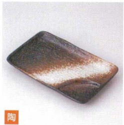
145-301-792 1,150円 黒備前7.0仕切皿(20.7×14×2.5) 1014350579 145-302-792 660円 黒備前6.0仕切皿(17.5×12×2.2) 614040579