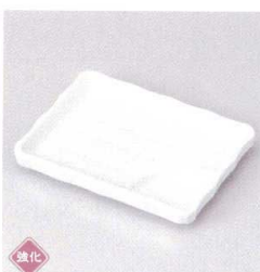
145-306-702 900円 白磁5.5長角仕切皿 (13.5×10.5×1.8) 813950570