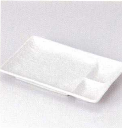
145-405-612 630円 トンカツ皿 白 (21.2×13.5×3) 713350261