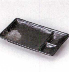
145-404-612 630円 天目白吹トンカツ皿 (21.2×13.5×3) 813940461