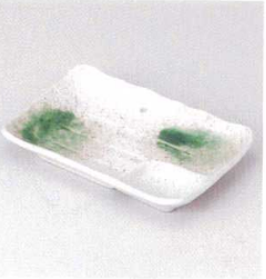
145-502-612 550円 6.0仕切皿 織部吹 (17×11.3×2.2) 513850461