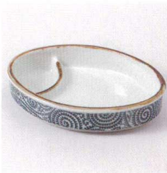
145-102-612 1,600円 タコ唐草 小判型仕切鉢 (19×14×4) 1104150261