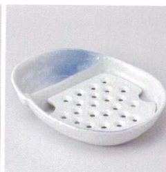
145-105-162 1,250円 やっこ鉢ブルー吹 (17×13×3.2) 505350316