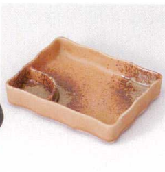
145-202-612 690円 伊賀織部仕切付皿 (14.6×11.5×3.1) 614040261