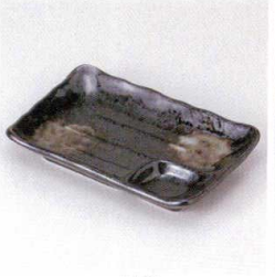
145-501-612 550円 6.0仕切皿 天目白吹 (17×11×2.3) 513850561