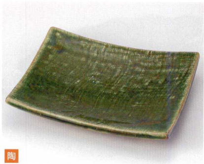
陶 19-103-052 4,000円 手造り 織部カヤメ四つ足長角皿(17.5×14.5×3.3) 1201910305