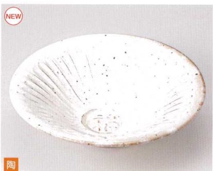
NEW 陶 19-402-072 3,250円 粉引そぎ福反向付(18.5×5.2) 1201940207