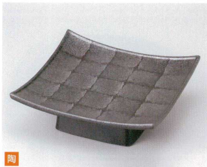
陶 19-301-082 3,900円 炭化銀彩市松高台向付(17×17×6) 902020208