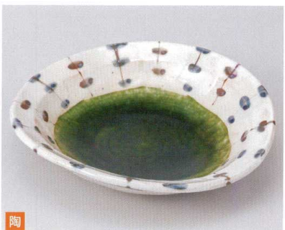
陶 19-203-252 3,900円 手描きすだれ織部楕円深皿(19×18.5×4.3) 801530125