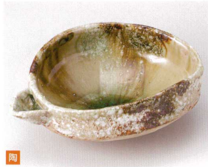
陶 19-101-052 4,000円 灰釉流片口向付(16.7×13×6) 503120305