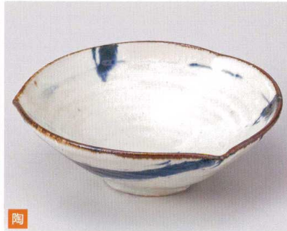
陶 19-102-332 4,000円 安南楽描三角平鉢(17×5.7) 801430133