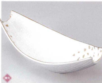
強化 19-201-782 4,020円 金吹雪向付(22.8×10×7) 503040378