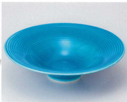
19-202-342 3,950円 トルコ交趾千段浅鉢(16×4.5) 701430234