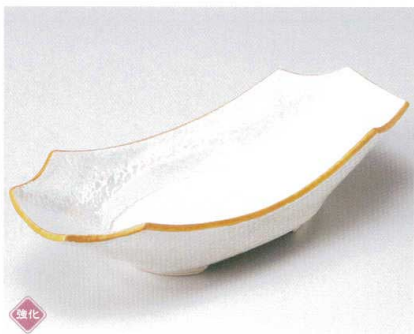
強化 19-302-782 3,920円 ラスター船型向付(23.2×9.6×5.7) 1101750278