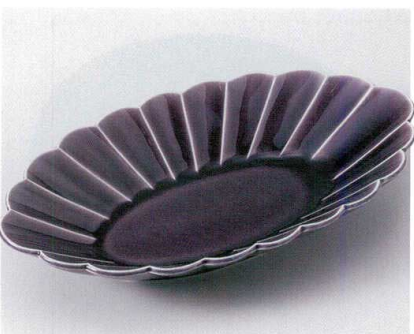
19-303-052 3,800円 アメシストフラワーボール(24.5×13.8×4.2) 1101830105