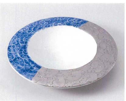
19-403-052 4,500円 プラチナ唐草向付(18.5×3.5) 1002310105