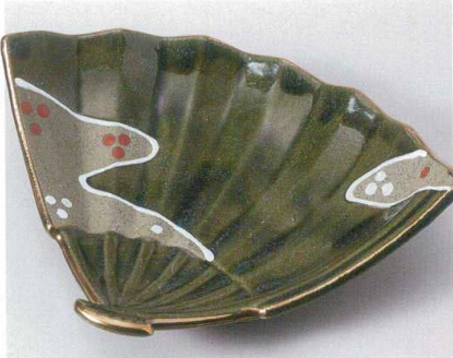
20-101-262 3,600円 金彩織部扇型向付(21×17.6×5.8) 1101940126