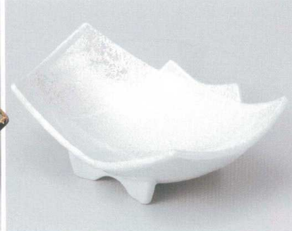
20-102-262 3,600円 パール合わせ小鉢(18.5×11.8×6.5) 802130226