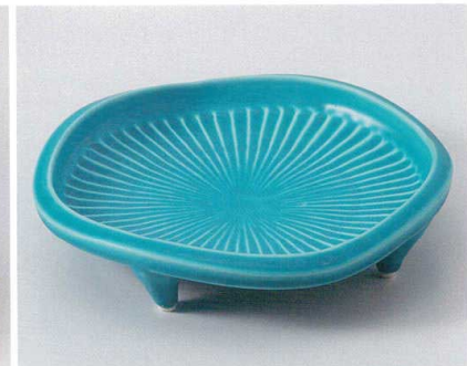
20-403-352 3,550円 トルコブルーマット四ッ足菊彫向付(17.5×4) 1102010235