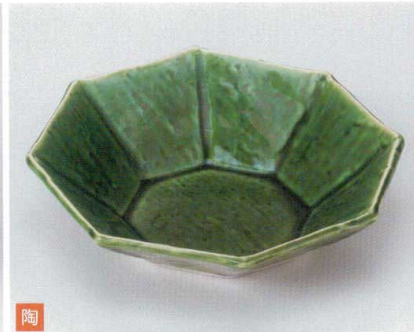
20-202-052 3,500円 織部八角鉢6.0(19.5×19.2×4.8) 902020105