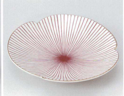
20-103-342 3,550円 千本赤十草三ツ割平鉢(19.5×20×3.5) 902130134