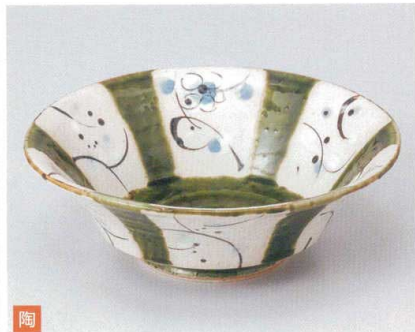
20-201-332 3,500円 織部まぼろば5.0鉢(16.7×5.7) 902640233