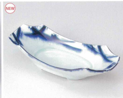
20-302-252 3,500円 青白磁手描き刷毛舟形向付(13.5×9.3×5.5) 1202030225