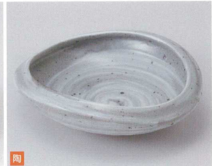
20-303-342 3,400円 粉引刷毛目楕円向付(15.5×14×4.5) 503330234