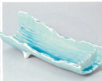
20-401-302 3,400円 マリンプルー竹割型向付(30.5×12.5×7.5) 602110330