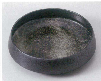
20-301-512 3,550円 黒唐津 くくり鉢(大)(19×5.2) 1101840251