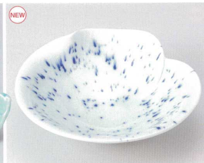
20-402-252 3,400円 青白磁呉須乱点向付(18×17.5×6) 1202040225