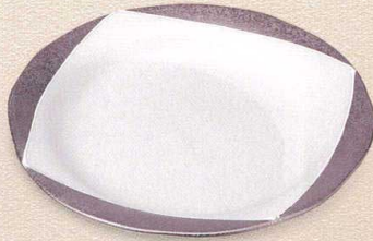
207-101-352 3,000円 プラチナスクエアつば付丸6.5皿 (19.5×2.3) 1120910135