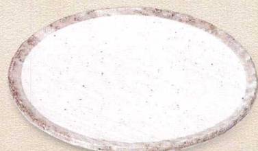
207-203-252 2,300円 白唐津8.0皿(25×2.5) 921230426