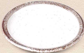
207-402-352 1,250円 刷錆粉引大皿(24×3) 719840235