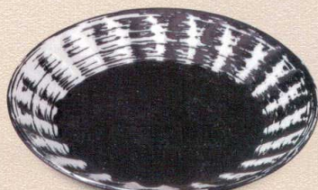
207-502-312 1,400円 備長しのき8.0皿(24.6×3.1) 1021740911