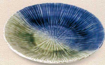
207-403-352 1,150円 二色流し彫十草大皿(25×3) 1021410335