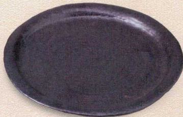
207-201-262 2,300円 結晶黒 マット8.0皿(φ24.7×2.6) 1021530426