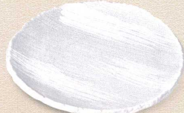
207-103-512 2,300円 堀川 濃8.0丸皿(25×2.3) 719810251