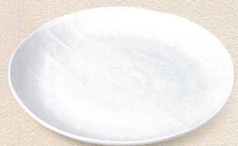
207-503-262 950円 ジュピター-W7.5皿(24.5×3) 820540126