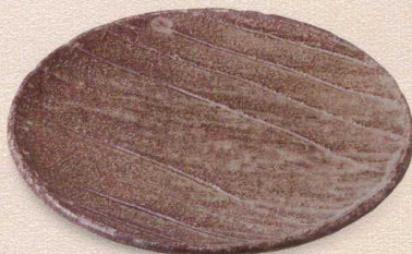
207-301-252 2,300円 越前8.0皿(25×2.1) 519720325