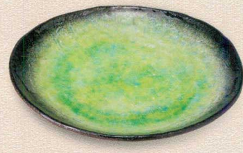
207-303-012 1,920円 藍染ヒワ80丸皿(24×23×4) 921220301