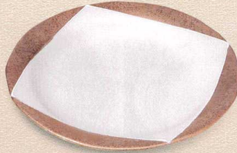
207-102-352 3,000円 ゴールドスクエアつば付丸6.5皿 (19.5×2.3) 1120910235