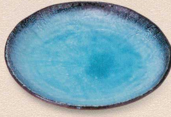
207-302-012 1,920円 藍染スカイ80丸皿(24×23×4) 720210401