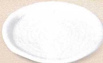
207-202-262 2,300円 白釉波皿(24.6×2.5) 820630126