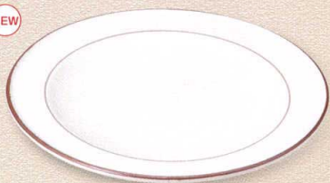
207-501-412 1,150円 ブラウンエッチ 8.0大皿 (24.6×2.7) 1220750141