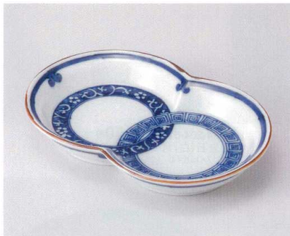
23-201-302 3,400円 輪つなぎ向付(16.5×11.2×2.2) 503450230