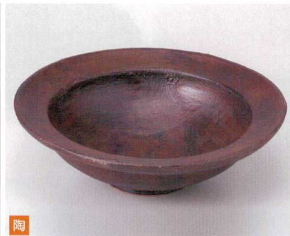
23-202-602 2,950円 根来 リム付17cm鉢(17.2×4.9) 504430460