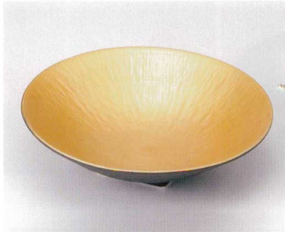
23-101-052 3,300円 金彩とちり向付(17×4.6) 902010205