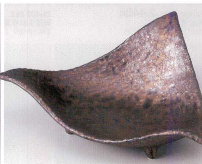
23-403-052 2,850円 金結晶砂目三角向付(23.5×18×8.5) 1002930205