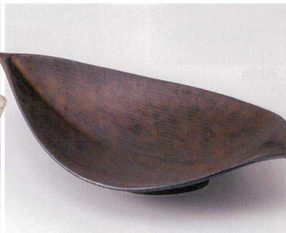
23-302-052 3,000円 金結晶葉型8.5向付(26×15×5.5) 1002920205