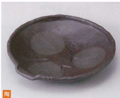
23-401-252 2,900円 炭化土ボタモチ櫛目片口6.0皿(18.3×18×3) 503430325