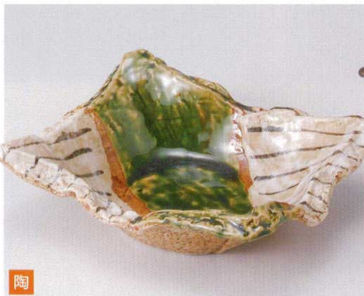
23-301-302 3,000円 織部細十草長角6.0向付(17.5×14.5×6.5) 503520230