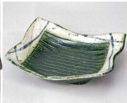
23-303-052 3,000円 織部筋彫長角6.0向付(18.5×16×5) 701220105