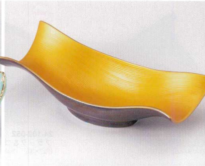
23-103-052 3,150円 アメ釉くびれ7寸向付ゴールド(21.8×9×6) 1002930305