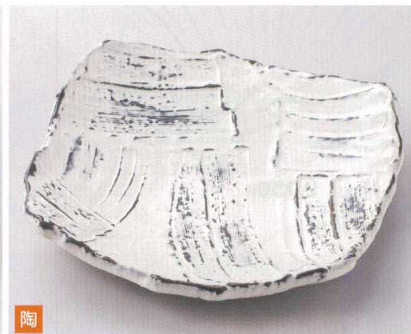
23-203-302 3,000円 粉引拭取り変型6.5皿(19.5×19.5×4.7) 602610430