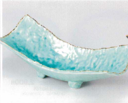
23-102-512 3,180円 測鑄マリンプル両上り向付(24.7×10.6×8.5) 902120151