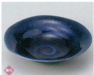
24-304-702 2,700円 紺勾玉平鉢 (19.3×5.4) 802240370