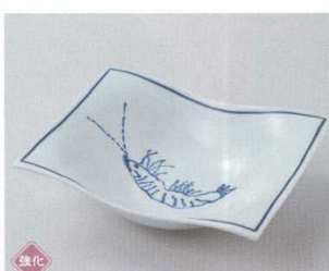
強化 24-503-742 2,640円 海老画四方向付 (16.2×12.3×4.5) 602840274