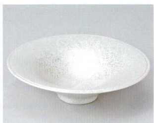
24-404-342 2,650円 ラスター吹平鉢 (16×4) 701440234