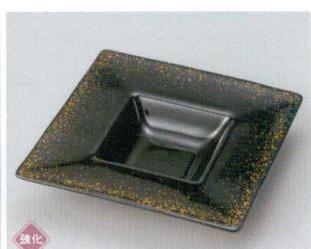
強化 24-504-262 2,650円 ゴールデングレーステラボール (16.7×16.7×3.3) 902650226