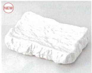
NEW 24-204-512 2,950円 岩石(白)角プレート (17×12.5×4) 1202420451