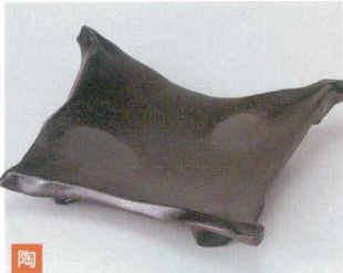
24-101-512 2,800円 炭化土向付 (605012) (21×19×4.5) 902920351