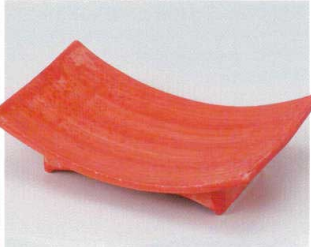
24-104-052 2,800円 ローズ赤弓型高台向付 (16.5×11.5×4.5) 902530205