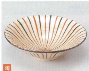
陶 24-201-052 2,750円 麦わら手平鉢 (15.5×4.8) 802920205