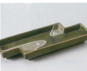
24-402-262 2,650円 織部金彩春夏段向付 (24.5×9×3.5) 1102420126