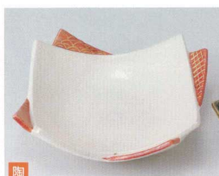
陶 24-401-782 2,440円 赤絵重ね皿(中) (15.5×15.5×4.5) 503640378