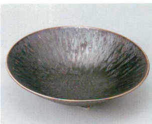
24-302-052 2,700円 孔雀釉とちり平鉢(小) (17.2×4.8) 902150205