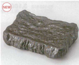
NEW 24-203-512 2,950円 岩石(黒)角プレート (17×12.5×4) 1202420351