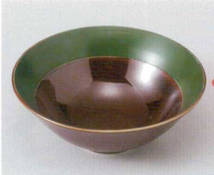
24-103-262 2,900円 obi 15.5cm鉢 (φ15.6×6) 1003050326