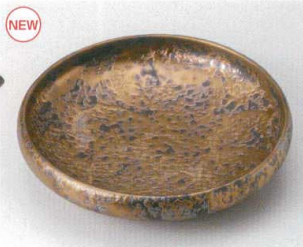
NEW 24-102-052 2,800円 ブラック&ゴールドくくり手鉢 小 (15.7×3.5) 1202410205