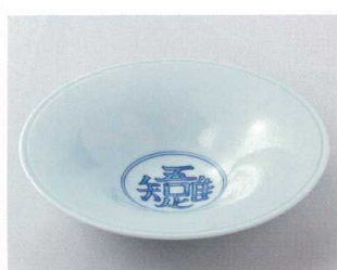
24-501-342 2,650円 染付漢詩見込5.0反鉢 (16×4.2) 602720134