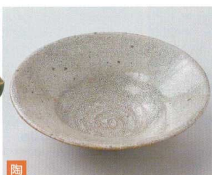
陶 24-403-082 2,650円 錆かいらぎ5.5鉢 (18×5.2) 602750208