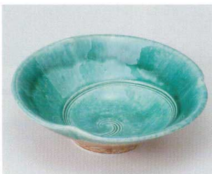
24-303-252 2,700円 グリーン伊賀三つ押し5.0鉢 (16×4.6) 902830225