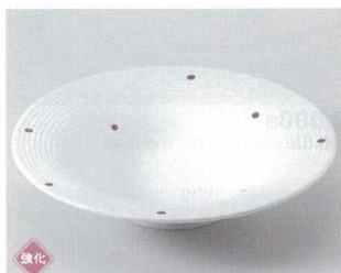
24-301-702 2,730円 淡雪向付 (φ18×4) 902120270