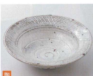
陶 24-502-342 2,650円 粉引三島彫5.5鉢 (18.2×5.3) 602710134