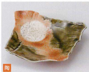
陶 25-403-512 2,200円 嵯峨野変形前菜皿 (17.5×16×5) 503710251