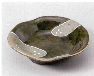
25-501-262 2,200円 金彩織部三つ足向付 (φ15.5×3.8) 1103810626