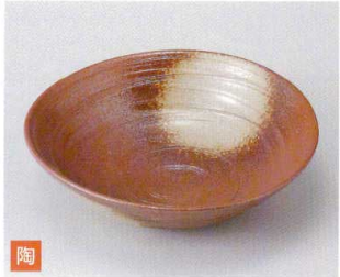
陶 25-104-742 2,480円 灰南蛮向付 (15.5×14.8×4.5) 503550174