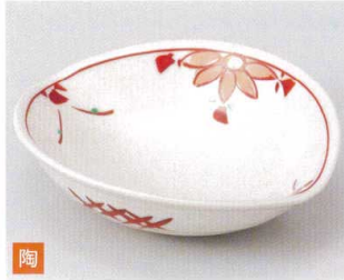
陶 25-102-742 2,400円 赤絵花つなぎすげ傘向付 (17.3×15×5.3) 802330274