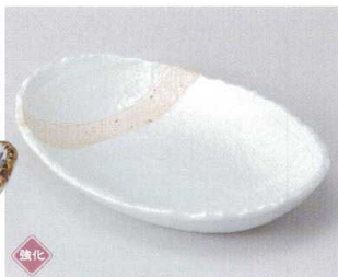
強化 25-303-702 2,340円 粉引塗分け6.5楕円ボール (19.8×13.1×3.7) 503710371