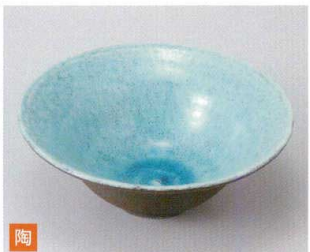
陶 25-404-152 2,800円 トルコこいらぎ5.0反鉢 (15.5×5.8) 503540315