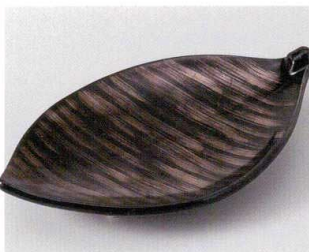
25-502-352 2,150円 カスリ金彩葉型向付 (22.7×13.5×4.8) 1102530335