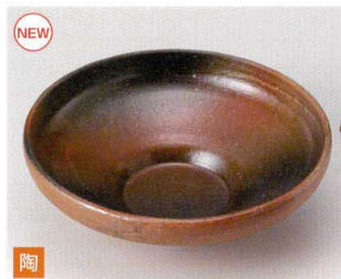
NEW 陶 25-301-252 2,490円 信楽黒18cmボール (18×5.9) 1202530125