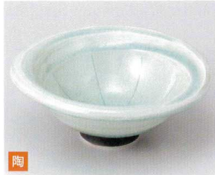
陶 25-101-702 2,540円 御深井ひねり向付 手造り (14.5×6.3) 802140170