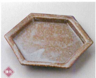
強化 25-304-052 2,500円 鼠志野六角皿 (19×16.5×2.3) 603030105