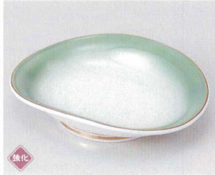
強化 25-103-262 2,550円 金彩若草楕円向付 (17×14.5×4) 902930326