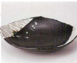
25-503-352 2,130円 黒織部角櫛目型5.5平鉢 (21.5×18×5) 701310135