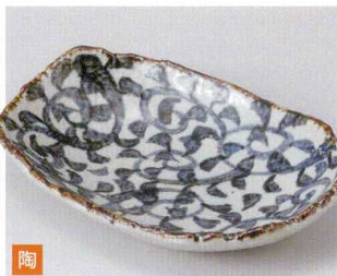
陶 25-302-052 2,350円 タコ唐草中鉢 (22×14.5×4.5) 503740205