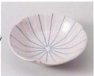
25-504-252 2,100円 桃山三つ押向付 (15.5×4.6) 1102540425

刺身 向付 中鉢 小鉢 小付 珍味 松花堂 前菜皿 付出皿 焼物皿 天皿 香水 蓋物 蒸碗 土瓶蓋し 小皿 和皿 多用皿 多用鉢 盛込鉢 盛込皿 酒器 フリー カップ そば用品 薬味皿 めん皿 井 多用井 濱佐見焼 特選 茶漬碗 飯碗 土瓶 ポット 急須 湯呑 千茶 カスター 卓上小物 箸置 レンゲ スプーン 灰皿