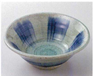
25-204-782 2,240円 御深井コス刷毛5.5平鉢 (16.7×5.7) 603010178