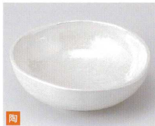
陶 25-201-702 2,450円 真珠5.0丸鉢 (17×15.8×5.5) 503750271