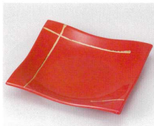
25-401-352 2,150円 一珍赤釉金線 正角前菜皿 (17×17×3.5) 902110135