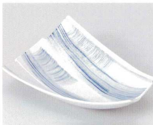
25-402-052 2,250円 青呉須貼合せ三角向付 (18.5×14.2×6) 902140105