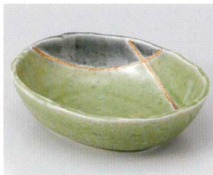
25-202-262 2,450円 若草金彩楕円中鉢 (17×13.8×5) 802130326