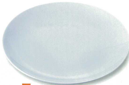
陶 259-103-842 6,000円 青地13.0皿(42.5×5) 1026920184 259-104-842 3,400円 青地12.0皿(36×3.5) 525730284 259-105-842 2,000円 青地10.0皿(31.5×3) 525730384