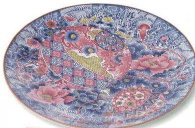
陶 259-204-822 3,400円 てまり12.0大皿(37×37×4.5) 525720382 259-205-822 2,600円 てまり10.0大皿(32×32×4) 525720482