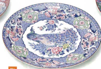
陶 259-402-812 2,600円 伊万里孔雀10.0皿(31.5×3) 724910681