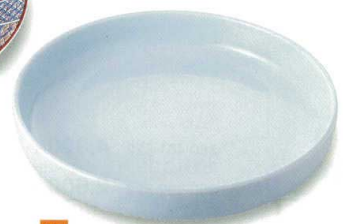
陶 259-404-812 3,100円 青磁10.0盛鉢(30×6) 525740581