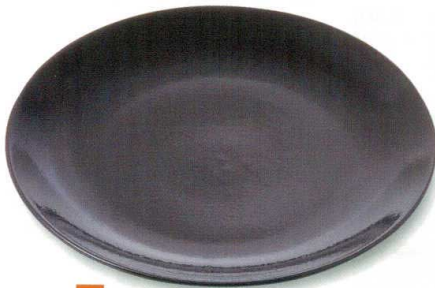
陶 259-201-812 6,000円 ゆず天目13.0丸皿(41.5×5.5) 525730481 259-202-812 3,200円 ゆず天目12.0丸皿(37×3.5) 525730581 259-203-812 2,500円 ゆず天目10.0丸皿(31.5×3) 525730681