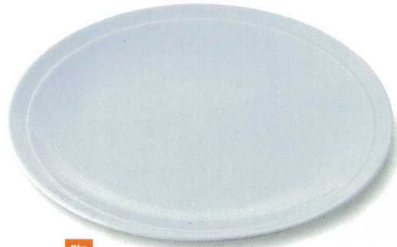
陶 259-101-812 3,600円 高台青磁12.0皿(38×4.5) 525740281 259-102-812 3,200円 高台青磁11.0皿(34.5×4) 525740381