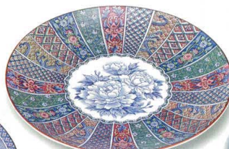
陶 259-403-812 2,600円 染錦10.0皿(31.5×3) 724920181