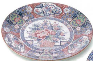
陶 259-401-812 2,600円 花かご10.0皿(31.5×3) 525740181