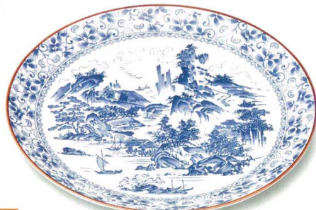
陶 259-302-822 5,500円 新古木山水13.0皿(42×42×5.5) 724920582 259-303-822 3,100円 新古木山水12.0皿(37×37×4.5) 724920682 259-304-822 2,000円 新古木山水10.0皿(32×32×4) 724920782