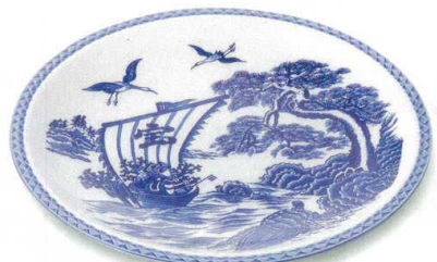
陶 259-206-822 3,100円 宝舟12.0大皿(36.5×36.5×4) 525710182 259-207-822 1,800円 宝舟10.0大皿(32×32×3.5) 525710282