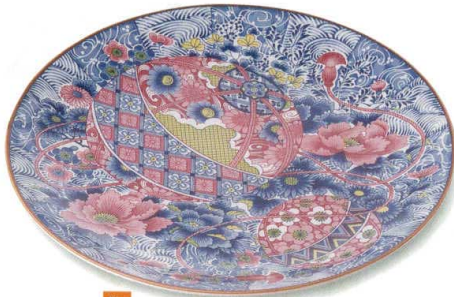
陶 259-301-822 5,900円 てまり13.0大皿(42×42×5.5) 525720282