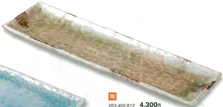
陶 263-402-812 4,300円 砂ビードロ50cmロング皿 (50×15×2.8) 1027330181