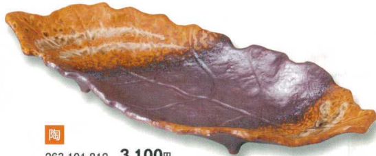
陶 263-101-812 3,100円 備前一珍木の葉盛皿 大(40×17×6) 927120281 263-102-812 1,800円 備前一珍木の葉盛皿 中(33.5×14.5×3.8) 927120381