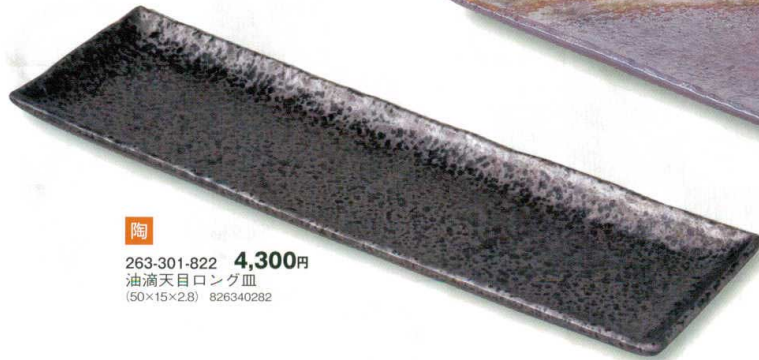
陶 263-301-822 4,300円 油滴天目ロング皿 (50×15×2.8) 826340282