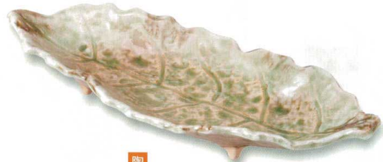
陶 263-202-812 3,100円 砂ビードロ木ノ葉盛皿(40×17×6) 526120381 263-203-812 1,800円 砂ビードロ木の葉盛皿 中(33.5×14.5×3.8) 927110281