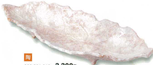
陶 263-201-812 3,300円 粉引木ノ葉盛皿(40×17×6) 526120181