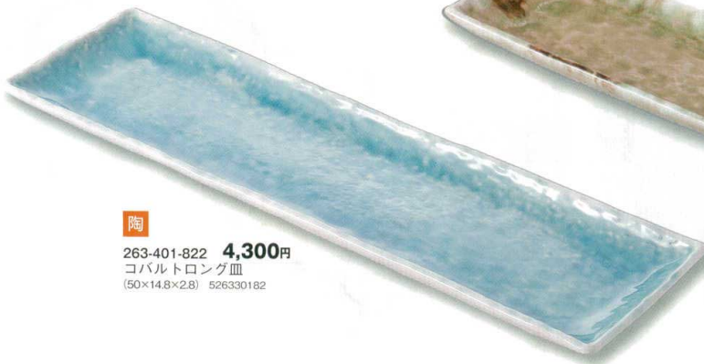
陶 263-401-822 4,300円 コバルトロング皿 (50×14.8×2.8) 826330182