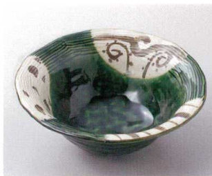
27-302-352 1,600円 山里 線段 5.0鉢 (17×16×6.5) 603320435