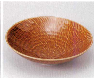
27-204-252 1,650円 かごクラフト鉢16cm浅鉢 (16.4×4.4) 903250225