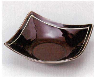
27-101-262 1,800円 琥珀スクエアボール中 (15.7×15.7×5.3) 903110526