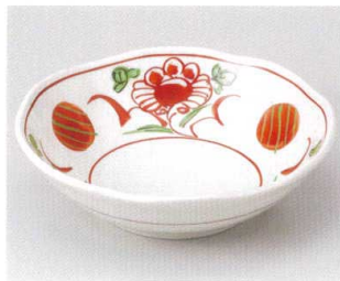
27-301-262 1,700円 手描き赤絵万暦手造り風平鉢 (16.7×5) 802030226