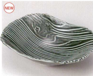
27-201-352 1,700円 黒屋久島木目型中鉢 (21×16×5.8) 1202720135