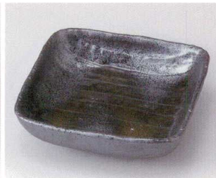
27-203-512 1,750円 南蛮Nライン5.5角鉢 (16×16×4.8) 503930151