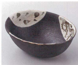
27-403-352 1,550円 いぶし山里 楕円深鉢 (17×13.7×6.3) 603250435