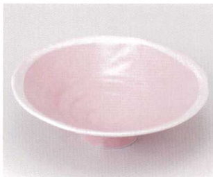
27-402-162 1,540円 ピンク水晶平鉢 (16×5) 903140316