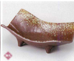
27-104-782 2,070円 信楽吹 向付 (17.5×10.5×6) 903530178