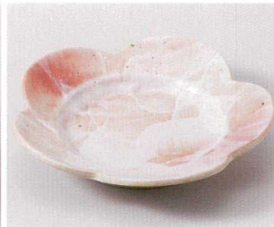
27-103-162 1,740円 桜志野梅型鉢 (17.8×3.5) 1102650416