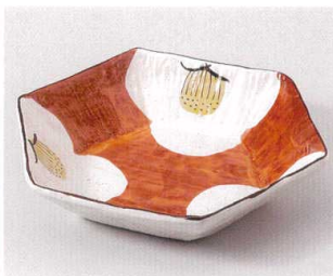
27-502-152 1,800円 六角鉢 赤濃椿 (18.8×16.7×4) 1102730215