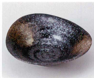
27-303-252 1,600円 黒窯変5.0寸鉢 (16.5×5) 702520425