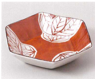
27-501-152 1,800円 六角鉢 赤濃木の葉 (18.8×16.7×4) 1102730315