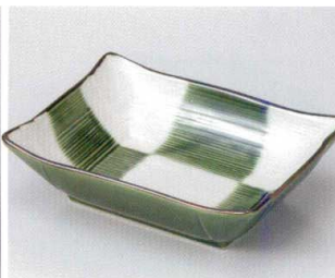
27-404-472 1,600円 織部市松コヨリ中鉢 (16×12.2×4.6) 802450347