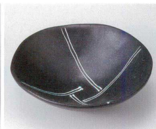
27-304-352 1,500円 いぶし黒円錐鉢 (17.2×6) 504930335