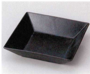
27-401-542 1,700円 紺斑点 正角鉢(中) (18×18×4.3) 802720154