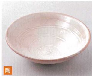
27-102-742 1,750円 粉引向付 (14.7×5) 503840274