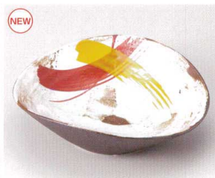
27-503-262 1,550円 染付二色刷毛粉引南蛮16.5cm楕円鉢 (16.5×15×5) 1202750326