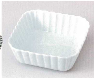
27-202-602 1,680円 青磁菊型 正角6.0鉢 (15.3×15.3×5.3) 1003320460