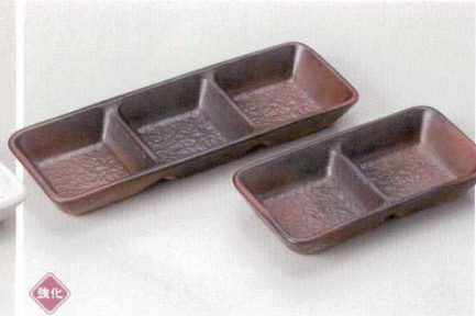
293-103-702 1,350円 黒彩3品盛(大) (21.6×7.8×2.5) 1229310370 293-104-702 1,150円 黒彩2品盛(大) (14.8×7.7×2.6) 1229310470