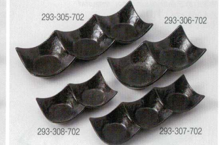
293-305-702 1,250円 瀬戸黒石目3連皿(小) (20.3×6.7×3.3) 629040370 293-306-702 1,000円 瀬戸黒石目2連皿(小) (13.6×6.7×3.2) 629040470 293-307-702 890円 瀬戸黒石目型3連皿 (15.5×5×2.5) 1130040570 293-308-702 650円 瀬戸黒石目型2連皿 (10.3×5×2.5) 1130040670