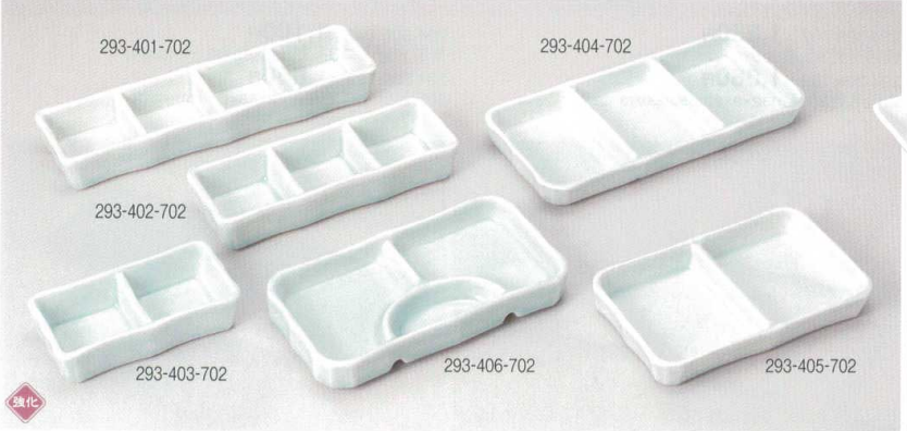
293-401-702 1,400円 青白磁4品皿 (21.9×5.8×2.8) 1229340170 293-402-702 1,050円 青白磁3品皿(小) (16.4×5.8×2.8) 1229340270 293-403-702 720円 青白磁2品皿(小) (11×5.8×2.8) 1229340370 293-404-702 1,350円 青白磁3品皿(大) (19.8×9.2×2) 1229340470 293-405-702 1,050円 青白磁2品皿(大) (14.5×8.6×2) 1229340570 293-406-702 1,200円 青白磁多用3品皿 (16.4×8.7×2.4) 1229340670