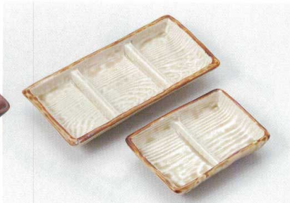
293-105-702 1,150円 木目3品盛 (18×9×2.5) 529230573 293-106-702 720円 木目2品盛 (11.5×8.5×2.5) 529230673