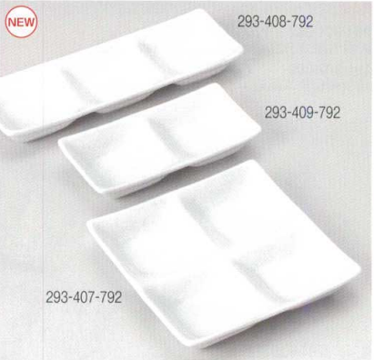
293-407-792 1,300円 スワン四品皿 白 (13.5×13.5×2.5) 1229340779 293-408-792 900円 スワン三品皿 白 (20.4×6.8×2.7) 1229340879 293-409-792 650円 スワン二品皿 白 (13.5×6.8×2.7) 1229340979