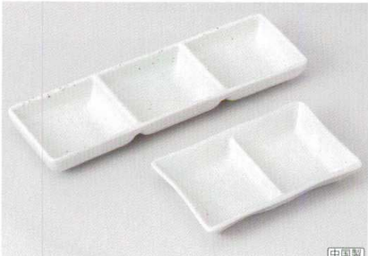
293-205-522 480円 粉引三品皿 (19.4×6.2×2.2) 1030950152 293-206-522 320円 粉引二品皿 (11.5×7.2×2) 1030950252