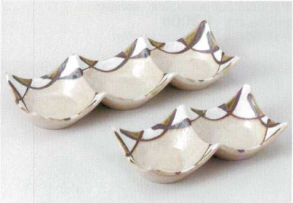
293-309-702 1,500円 白い波石目3連皿(小) (20.2×6.6×3.3) 629240573 293-310-702 1,200円 白い波石目2連皿(小) (13.5×6.6×3.3) 629240673