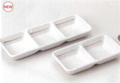
293-101-702 1,350円 ねずみ志野3品盛(大) (21.6×7.8×2.5) 1229310170 293-102-702 1,150円 ねずみ志野2品盛(大) (14.8×7.7×2.6) 1229310270