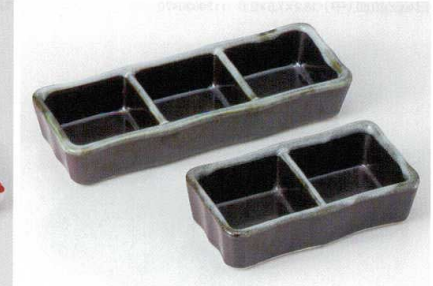
293-203-702 1,050円 鉄結晶3品皿(小) (17×6×2.8) 529350373 293-204-702 750円 鉄結晶2品皿(小) (11.2×6×2.8) 529350473