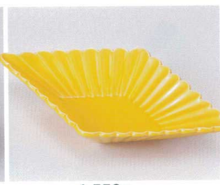
34-301-522 1,700円 備前風 サラダ鉢 (15×15×6.5) 604350352