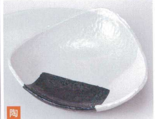
34-101-352 1,950円 白伊賀金線変型小鉢 (15×11.5×6.2) 803250435