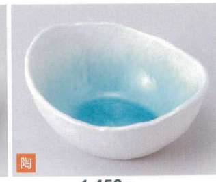
34-501-252 1,400円 伊賀化粧花型鉢(中) (16×11×4.5) 604440325