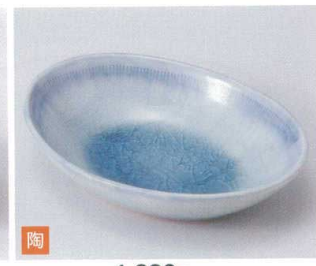
34-401-262 1,500円 吹墨三足向付 (15×4.5) 818420226