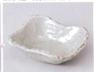
34-201-472 1,850円 白押花ボール(L) (14.8×4.7) 504830147