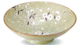
437-60-542 1,650円 8.0盛鉢 (24.5×8) 1047206054