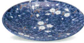
437-3-542 1,450円 8.0皿 (25.6×3.4) 1047200354