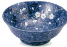
437-10-542 1,350円 6.8高台ラーメン丼 (21×8.5-1300cc) 1047201054