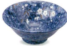
437-9-542 800円 6.5そば丼 (19.5×8) 1047200954