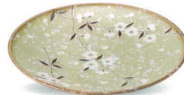
437-53-542 1,450円 8.0皿 (25.6×3.4) 1047205354