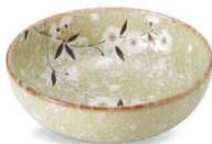
437-57-542 900円 5.5ボール (17.3×6) 1047205754