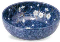
437-8-542 1,300円 6.5ボール (19.7×7.2) 1047200854