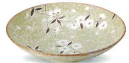
437-55-542 900円 三ツ輪7.5めん皿 (22.8×5) 1047205554