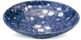
437-5-542 900円 三ツ輪7.5めん皿 (22.8×5) 1047200554