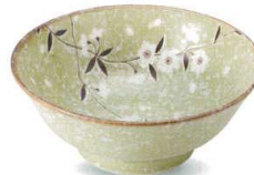
437-59-542 1,350円 6.8高台ラーメン丼 (21×8.5-1300cc) 1047205954