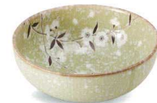
437-58-542 1,300円 6.5ボール (19.7×7.2) 1047205854