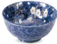
437-13-542 900円 5.5多用井 (16.8×8.8) 1047201354