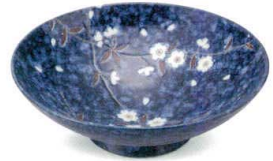
437-11-542 1,650円 8.0盛鉢 (24.5×8) 1047201154