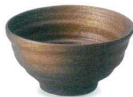
448-10-412 2,150円 ろくろ目井(17.7×9.2) 844500541