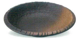
448-9-412 2,250円 8.0麵鉢(25×5) 844500641