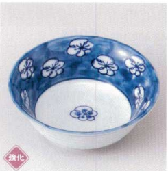
強化 47-404-782 1,040円 梅づくし花型3.5小鉢 (10.3×3.7) 1005340578