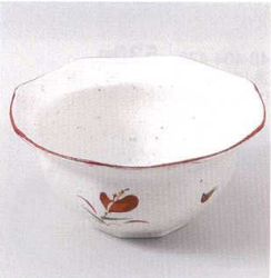
47-402-472 1,250円 白粉引花ひらり八角小鉢(大) (12×5.5) 1104660547