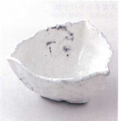
47-501-612 1,400円 粉引三角小鉢 (10.7×10.2×5.2) 605610361