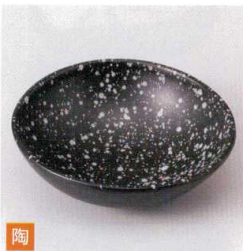
陶 47-303-742 1,100円 BKマットエッグボール (13.8×12.9×4.2) 1005320174