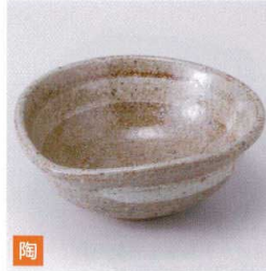
陶 47-101-522 1,400円 土灰釉楕円小鉢 (12.8×11.8×4.8) 506050252