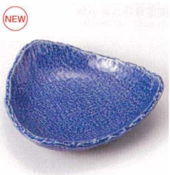
NEW 47-503-782 1,050円 ルリ三角鉢 (13×13×3) 1204750378