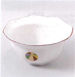
47-401-472 1,250円 白粉引夢風船八角小鉢(大) (12×5.5) 1104660447