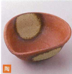
陶 47-102-522 1,400円 伊賀火色楕円小鉢 (12.8×11.8×4.8) 506050152