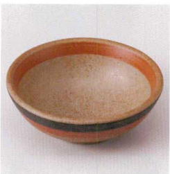
47-304-742 1,020円 二色帯3.0小鉢 (10.3×3.8) 1005350174