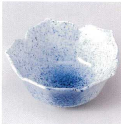
47-301-052 1,200円 桔梗型小鉢 吹墨 (11.5×11.5×5) 1005330105