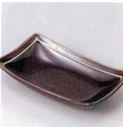
47-203-262 1,250円 琥珀ロングボール (16×9.2×3.5) 804760226