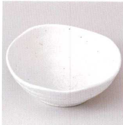
47-104-782 1,170円 そば化粧小鉢(大) (12.4×12.2×4.5) 1005550178