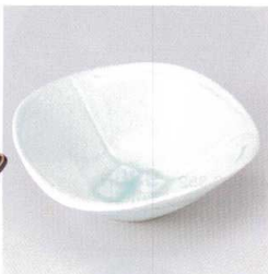
47-204-252 1,100円 青磁市松彫三角3.8鉢 (11.4×4) 905130425