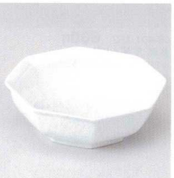
47-405-032 1,000円 八角鉢 白 浅鉢 (12×3.7) 905130503