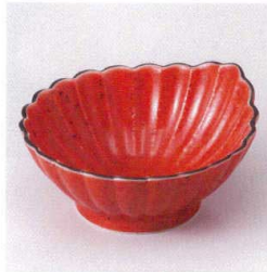
47-201-472 1,320円 レッド黒洩菊型小鉢 (11×10.5×5) 1005220447