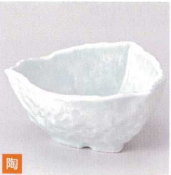
陶 47-502-512 1,200円 青白磁三角小鉢 (10.7×10.2×5.2) 605750551