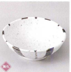
強化 47-505-702 950円 錆十草香水小鉢 (10.7×4.2) 1005340670