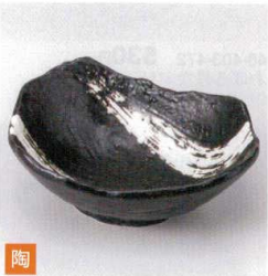
陶 47-403-412 1,030円 黒炭白刷毛 小鉢 (14.3×12.5×5.8) 804920241