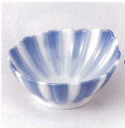
47-202-472 1,320円 塩化十草菊型小鉢 (11×10.5×5) 1005220547