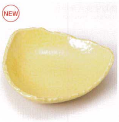
NEW 47-504-782 1,050円 アイボリー 三角鉢 (13×13×3) 1204750478