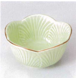
47-302-782 1,300円 測金ヒワ葉型小鉢 大 (φ10×5) 1005340278