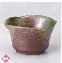
強化 47-305-702 1,000円 南蛮織部四方小鉢 (9×9×5.7) 507550670