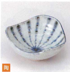
陶 47-105-742 1,270円 御深井十草3.5小鉢 (11×11×5) 506120274