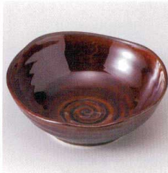
47-103-782 1,170円 アメ釉小鉢(大) (12.4×12.2×4.5) 1005550278