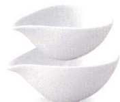
545-29-412 1,000円 片口鉢 S/WH (14.8 × 8.8 × 5.5) 749000311