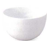
545-17-412 1,850円 レシピアラカルトボウル /M (14.6 × 8.4) 749101011