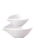
545-27-412 600円 片口鉢 SSS/WH (9 × 5.8 × 3.5) 749000511