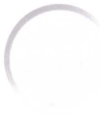
545-1-412 3,600円 アーバン 26.5 ピザプレート (26.5 × 1.5) 856303411