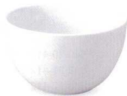
545-18-412 3,000円 レシピアラカルトボウル /L (17.6 × 10) 749100911