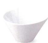
545-20-412 1,800円 スラッシュボウル /M (15 × 8.8) 748903611