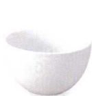
545-16-412 1,250円 レシピアラカルトボウル /S (12.3 × 7.2) 749101111