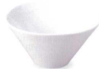
545-21-412 2,500円 スラッシュボウル /L (18.8 × 10) 748903511