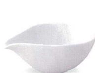
545-31-412 1,600円 片口鉢 L/WH (18.3 × 11.2 × 6.8) 749000111