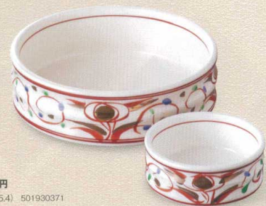
強化 6-203-702 4,430円 赤絵華紋刺身鉢(14.1×5.4) 501930371 6-204-702 1,640円 赤絵華紋千代口(7.8×3.8) 501930471