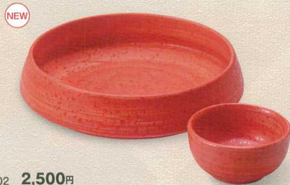
NEW 6-201-302 2,500円 朱巻くくり鉢(15.5×4.4) 1200620130 6-202-302 750円 朱巻千代口(6.3×3.7) 1200620230