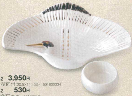
6-101-342 3,950円 高麗つる型向付(20.5×14×5.5) 501830334 6-102-342 530円 高麗丸千代口(6×3) 501830434