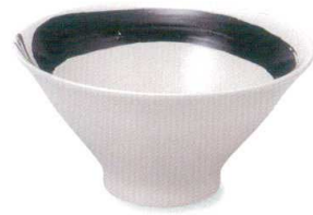
656-304-032 2,200円 白海流6.5薄筋高ハマ井 (20×10-1100cc) 1170020403