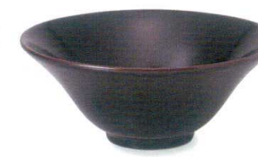
656-503-012 2,350円 黒天目 桂林井小 (20.5×8.7-1100cc) 969520301