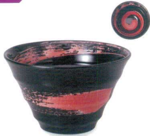
656-101-612 2,550円 あかつき渦6.0井(18.3×11.3-1300cc) 969510461 656-102-612 2,100円 あかつき渦5.0井(16.5×9.5-750cc) 969510561