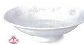
強化 656-406-262 3,900円 スーパーチャイナ華清(絵付)7.0寸丸高台皿 (20.8×5.7) 865810726