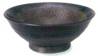
656-407-332 2,100円 結晶天目7.0寸井 (20.5×8.3-1200cc) 969540233