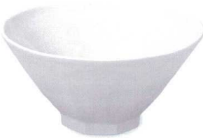
656-301-032 2,200円 白八角7.0井(22×11.4-1700cc) 1170020103 656-302-032 1,980円 白八角6.3井(19×9.7-1160cc) 1170020203