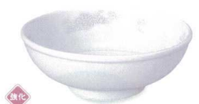
強化 656-401-262 6,200円 スーパーチャイナ華清(絵付)7.0寸玉井(21.2×7.8-1350cc) 865810326 656-402-262 4,600円 スーパーチャイナ華清(絵付)6.5寸玉井(19.3×7.2-1050cc) 865810426 656-403-262 3,550円 スーパーチャイナ華清(絵付)5.0寸玉井(15.6×6.2-570cc) 865810526