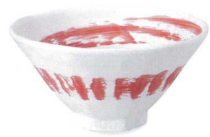
656-107-612 3,300円 あけぼの八角7.0井(21.8×11-1700cc) 969510361 656-108-612 2,550円 あけぼの八角6.3井(19.5×9.7-1160cc) 1069410461