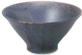
656-201-612 2,450円 わび紺ねず6.5千段高ハマ井 (20×10-1100cc) 1069520561