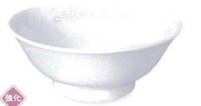
強化 656-404-262 4,600円 スーパーチャイナ華清(絵付)7.0寸反高台井 (20.9×8.5-1250cc) 865810126 656-405-262 3,200円 スーパーチャイナ華清(絵付)6.5寸反高台井 (19.5×8-1150cc) 865810226