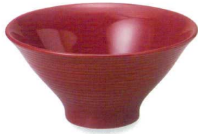
656-202-612 2,800円 千段朱6.5ハマ井 (20×10-1100cc) 1069530161