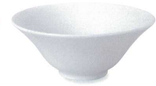
656-504-012 2,200円 白 桂林井小 (20.5×8.7-1100cc) 969520401