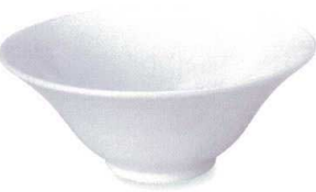
656-502-012 2,480円 白 桂林井大 (22.3×9-1400cc) 866140401