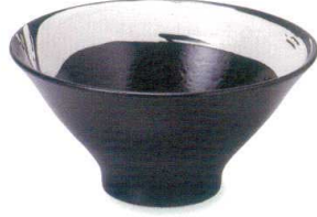
656-303-032 2,200円 黒海流6.5薄筋高ハマ井 (20×10-1100cc) 1170020303