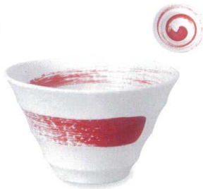
656-103-612 2,550円 あけぼの渦6.0井(18.3×11.3-1300cc) 969510661 656-104-612 2,100円 あけぼの渦5.0井(16.5×9.5-750cc) 969510761