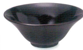
656-501-012 2,700円 黒天目 桂林井大 (22.3×9-1400cc) 866140301