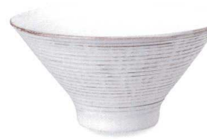
656-203-082 2,100円 錆粉引切立ラーメン (20×10-1200cc) 969650108