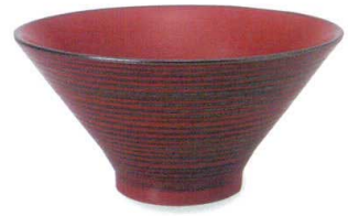
656-204-082 2,700円 根菜切立ラーメン (20×10-1200cc) 969650208