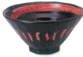
656-105-612 3,300円 あかつき八角7.0井(21.8×11-1700cc) 969510161 656-106-612 2,550円 あかつき八角6.3井(19.5×10-1160cc) 969510261