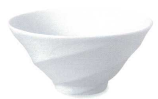
656-305-612 3,550円 白ブリーズ ボールL(21.7×7×10.7-1600cc) 969530361 656-306-612 2,400円 白ブリーズ ボールM(20×7.9-950cc) 969530461