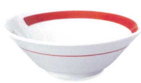
658-401-612 1,750円 漆器(手描)あかつき7.0切立井(21.4×7.5・1200cc) 660420361 658-402-612 1,490円 スリ鉢(手描)あかつき6.5切立井(19.4×7・900cc) 660420461