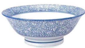
658-201-602 2,430円 たご唐草7.0反り高台井(21.6×8.4・1200cc) 560050160 658-202-602 2,230円 たご唐草6.5反り高台井(20.2×8・1050cc) 560050260