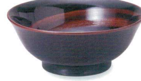
658-404-252 2,150円 錆天目高台6.8井 (20.3×8.3・1300cc) 762710425