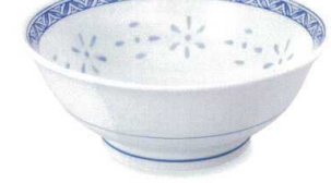
658-405-602 1,800円 青華ホタル6.8反高台井 (21×8.5・1350cc) 560130360