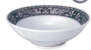
658-207-262 2,500円 鳳凰S6.8丸井(20.8×6.6・990cc) 865910326 658-208-262 2,200円 鳳凰S6.5丸井(19.5×7・900cc) 865910426