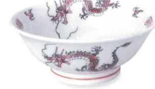
658-303-332 2,350円 おどり竜6.5反高台井 (20.2×8・1000cc) 866140233