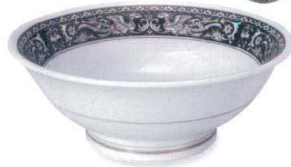
658-205-262 3,100円 鳳凰S7.0反高台井(21.9×8.4・1200cc) 865910126 658-206-262 2,800円 鳳凰S6.5反高台井(20.5×8・1060cc) 865910226