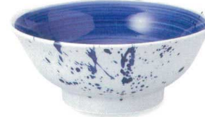
658-503-312 1,650円 海流7.0反井 (21.7×9・1300cc) 560040431