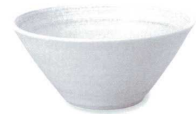
658-501-522 1,750円 ハケメ白雪6.5水輪めん井 (19.8×9・1260cc) 969750352