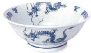
658-301-332 2,600円 おどり竜7.0反高台井 (21.7×8.5・1200cc) 866140133