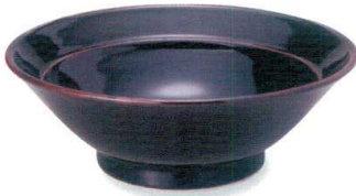
658-101-312 3,800円 高級うるし天目リム8.5反井(26×9.4・2050cc) 866310631 658-102-312 1,770円 高級うるし天目リム7.0反井(21.7×7.8・1150cc) 866310731 658-103-312 1,480円 高級うるし天目リム6.5反井(19.4×7.4・950cc) 866310831