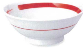
658-403-612 1,750円 漆器(手描)あかつき7.0高台井 (21.6×8.5・1350cc) 660420561