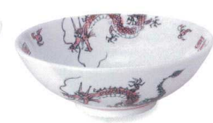
658-304-332 1,800円 おどり竜6.5丸井 (19.5×7・900cc) 866150233