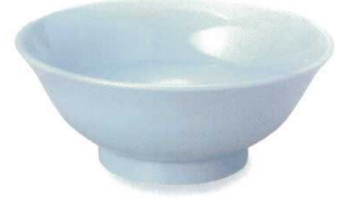
658-107-262 1,450円 青磁7.0反高台井(21.5×9・1320cc) 866310426 658-108-262 1,300円 青磁6.5反高台井(20×8・1200cc) 866310526