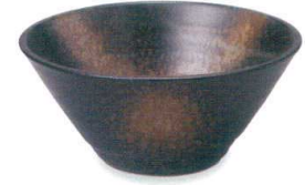
658-502-522 1,750円 月の輪6.5水輪めん井 (φ19.8×9・1260cc) 1069750152