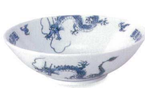
658-302-332 2,100円 おどり竜6.8丸井 (20.7×6.8・1000cc) 866150133