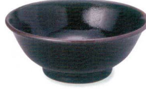
658-105-262 1,600円 柚子天目反高台7.0井(21.2×8.5・1300cc) 866310226 658-106-262 1,500円 柚子天目反高台6.8井(20.2×8.3・1200cc) 866310326