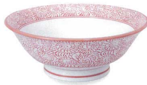
658-203-602 2,480円 たご唐草(赤)7.0反り高台井(21.6×8.4・1200cc) 969630160 658-204-602 2,260円 たご唐草(赤)6.5反り高台井(20.2×8・1050cc) 969630260