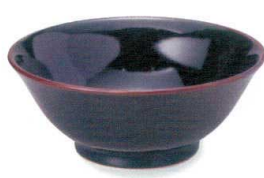
658-104-312 1,770円 高級うるし天目6.8井 (21×8.6・1280cc) 866330231