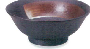
658-504-312 1,650円 黒海7.0反井 (21.7×9・1300cc) 969710431

和陶 オープン 洋陶 オープン ビュッフェ オープン 食器 スフレ 洋小物 碗皿 マグ スプレン 中華 オープン 中華単品 高古焼 土鍋 耐熱 ガラス 漆器 スリ鉢 薬土瓶 かめ 茶道具 インテリア 小物 花瓶 仏神具 傘立