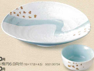
7-303-342 3,300円 パールラスター流水槽円6.0向付(19×17.8×4.5) 502130734 7-304-342 1,150円 パールラスター流水丸千代口(6.7×2.9) 502130834