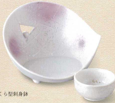
7-101-512 3,900円 紫吹一珍ラスターかまくら型刺身鉢 (15.5×15.2×9.9) 901010351 7-102-512 1,180円 ラスター丸千代久(6.3×3.3) 901010451