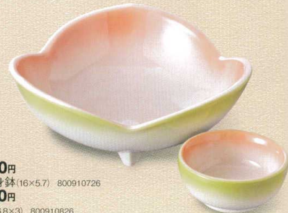
7-203-262 3,400円 二色吹き三ツ割刺身鉢(16×5.7) 800910726 7-204-262 900円 二色吹き丸千代口(6.8×3) 800910826