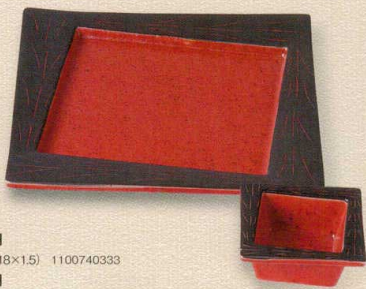
7-301-332 2,800円 黒巻彫レッド角皿(18×18×1.5) 1100740333 7-302-332 1,050円 黒巻彫レッド角千代口(6.8×6.8×2.8) 1100740433