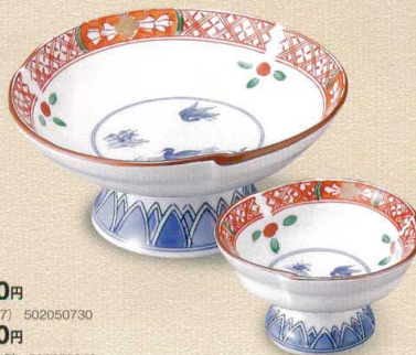
強化 7-403-302 4,600円 万暦高台刺身鉢(15×7) 502050730 7-404-302 1,750円 万暦高台千代口(8.7×5) 502050830