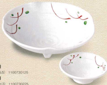
強化 7-201-252 3,300円 赤武蔵野 平向付(17.5×5.5) 1100730125 7-202-252 1,100円 赤武蔵野 平千代口(8.5×3) 1100730225