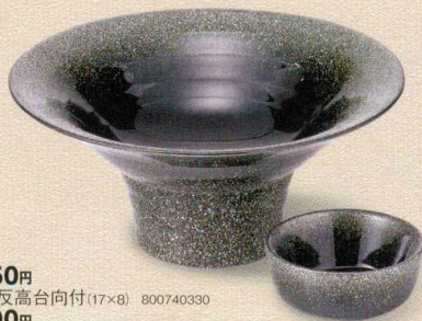
7-401-302 3,650円 コスモ(シルバー)反高台向付(17×8) 800740330 7-402-302 1,100円 コスモ(シルバー)丸千代口(6.7×3) 800740430