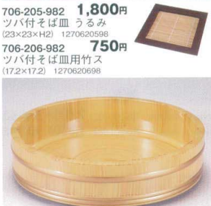
706-205-982 1,800円 ツバ付そば皿 うるみ (23×23×H2) 1270620598