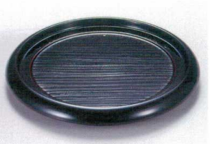
706-107-982 1,200円 刷毛目そば皿 溜 (φ23.5×H2.8) 767010798