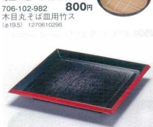
706-102-982 800円 木目丸そば皿用竹ス (φ19.5) 1270610298