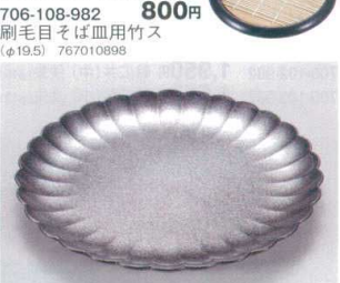
706-108-982 800円 刷毛目そば皿用竹ス (φ19.5) 767010898