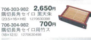
706-303-982 2,650円 隅切長角セイロ 黒天朱 (23.5×16×H6) 1270630398