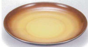
706-306-982 800円 桶型そばセイロ用竹ス (φ19.5) 1270630698