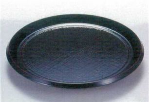
706-105-982 1,050円 布目丸そば皿 溜 (φ23.2×H3) 767010598