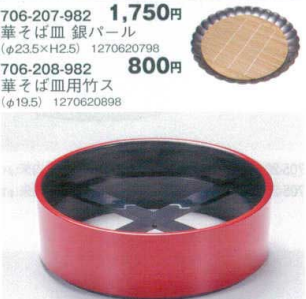
706-207-982 1,750円 華そば皿 銀パール (φ23.5×H2.5) 1270620798