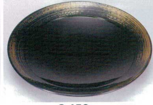
706-406-982 700円 8.0 ロク口血鉢用 PP竹ス (φ19.5) 870240698