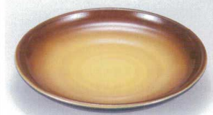
706-302-982 750円 宝祥そば皿用竹ス (17.2×17.2) 767030298