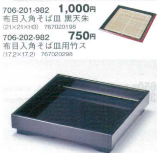
706-201-982 1,000円 布目入角そば皿 黒天朱 (21×21×H3) 767020198