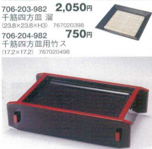
706-203-982 2,050円 千筋四方皿 溜 (23.8×23.8×H3) 767020398