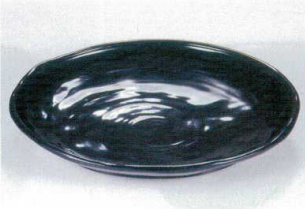
706-103-982 980円 白山そば皿 黒 (24.5×22.5×H3) 767010398