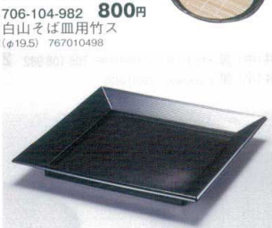
706-104-982 800円 白山そば皿用竹ス (φ19.5) 767010498