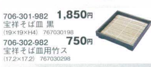
706-301-982 1,850円 宝祥そば皿 黒 (19×19×H4) 767030198