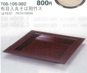
706-106-982 800円 布目丸そば皿用竹ス (φ19.5) 767010698