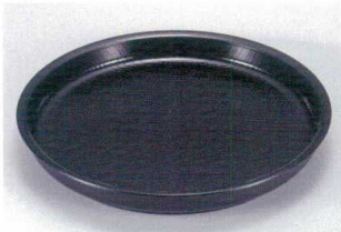
706-101-982 1,150円 木目丸そば皿 黒 (φ22×H3) 1270610198

和陶 オープン 洋陶 オープン ビコフエ オープン 食器 スフレ 洋小物 漆皿 マダ スゴカガ 中環 オープン 中環 華品 萬古焼 土鍋 耐熱 ガラス 漆器 スリ鉢 薬土瓶 かめ 茶道具 インテリア 小物 花瓶 仏器具 傘立