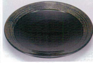
706-402-982 450円 7.0 ロク口血鉢用 PP竹ス (φ16.5) 870240298