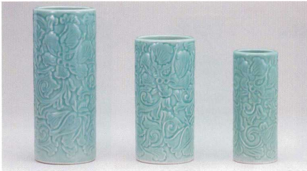
741-101-792 4,600円 唐草投入尺 (φ12.5×30.5) 1077110179 741-102-792 4,200円 唐草投入8.0 (φ12.×24.5) 1077110279 741-103-792 2,650円 唐草投入7.0 (φ9×21.5) 1077110379