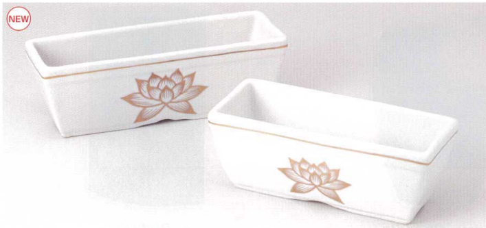
NEW 741-401-702 2,500円 金ハス長角香炉6.0 (19.3×7×6.2) 1274140170 741-402-702 2,200円 金ハス長角香炉5.0 (16.2×9×6.2) 1274140270