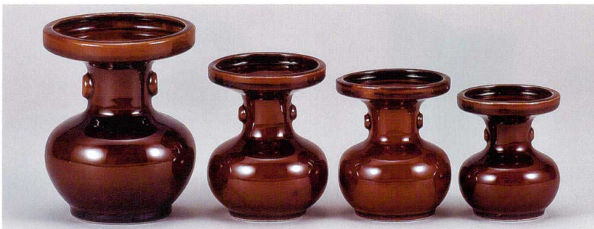
741-501-572 2,250円 松立6寸 (14×18) 571740157 741-502-572 1,350円 松立5寸 (11.5×14.5) 571740257 741-503-572 1,200円 松立4.5寸 (11×13) 571740357 741-504-572 1,100円 松立4寸 (9.5×11.5) 571740457