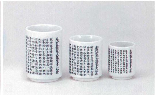
741-403-572 740円 心経湯呑(大) (7.2×10.3) 772250857 741-404-572 530円 心経湯呑(小) (6.5×8) 772250957 741-405-572 370円 心経湯呑(ミニ) (5.5×6.8) 772251057