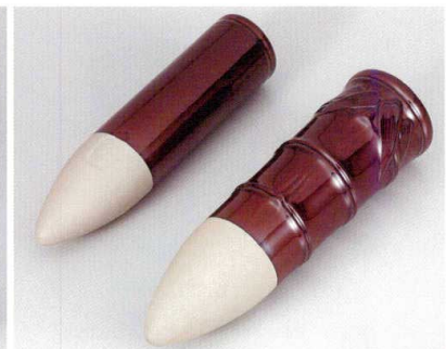
741-505-012 600円 野花立(大) (6×26) 571750101 741-506-012 1,100円 野花立(特大) (8.5×30) 571750301

和陶 オープン 洋陶 オープン ビュッフェ オープン 食器 スフレ 洋小物 碗皿 マグ スープカブ 中華 オープン 中華 卓品 萬古焼 土鍋 耐熱 ガラス 漆器 スリ鉢 薬土瓶 かめ 茶道具 インテリア 小物 花瓶 仏神具 傘立