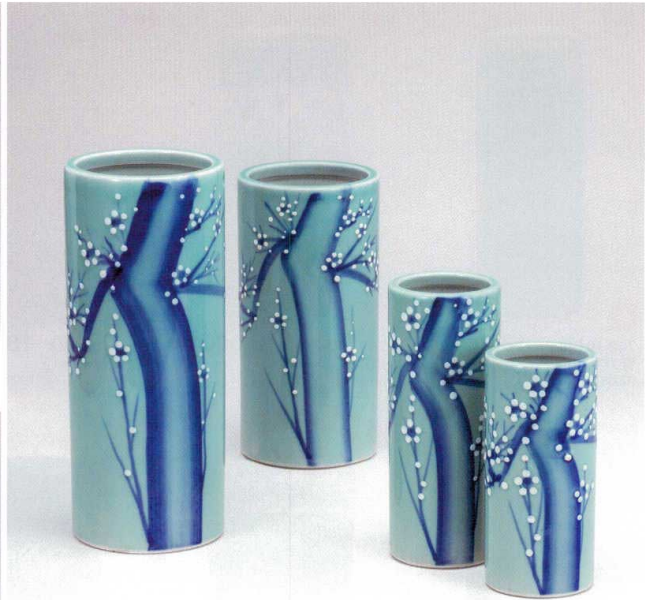
741-301-792 4,900円 梅投入尺 (φ12.5×30.3) 1077130179 741-302-792 4,600円 梅投入れ8.0 (φ12×24.8) 1077130279 741-303-792 2,900円 梅投入れ7.0 (φ8.5×22) 1077130379 741-304-792 2,750円 梅投入れ6.0 (φ8.5×18) 1077130479