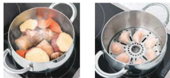
⑨スティームスタンド対応商品