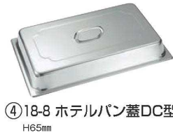
④ 18-8 ホテルパン蓋DC型 H65mm