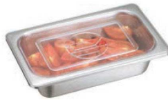
⑥ ポリカーボネイト ホテルパン蓋PCタイプ ●ポリカーボネイトで耐久性に優れています。 ●耐熱温度(-45℃~120℃)