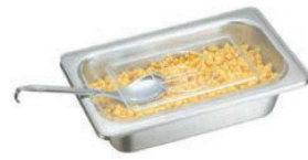
⑦ ポリカーボネイト ホテルパン蓋 PNCタイプ ●ポリカーボネイトで耐久性に優れています。 ●耐熱温度(-45℃~120℃)