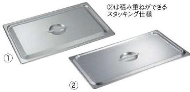
① 18-8 ホテルパン蓋C型 ② 18-8 ホテルパン蓋C型 (スタッキング付)