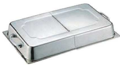
⑤ 18-8 ホテルパン蓋DH型 (蝶番付) H65mm