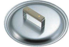
④ステンレス ギョーザ鍋用蓋