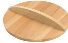
③EBM さわら 木蓋 (ギョーザ鍋用蓋兼用)