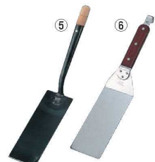
⑤EBM 鉄 ギョーザ返し