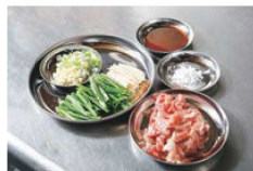
㉑SUS AM-3 抗菌丸型仕込皿