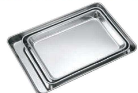
⑲18-0 角型 仕込皿