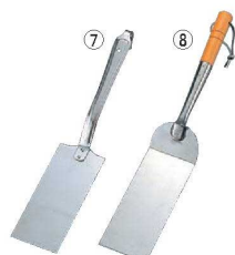
⑦UK 18-8 ギョーザ返し