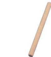
⑬EBM ギョーザ用 めん棒 (ブナ材)