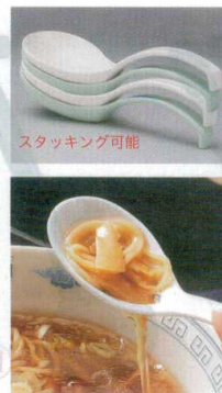
7-1093-22 (60001800) ハートホールレンゲ アイボリーOM ¥450 7-1093-23 (60001810) ハートホールレンゲ 黒OM ¥450