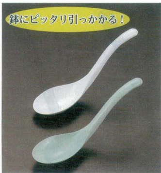
7-1093-18 (48131050) 172ラーメンレンゲ アイボリーOM ¥370 172×45 AC 7-1093-19 (48131060) 172ラーメンレンゲ 青磁OM ¥370