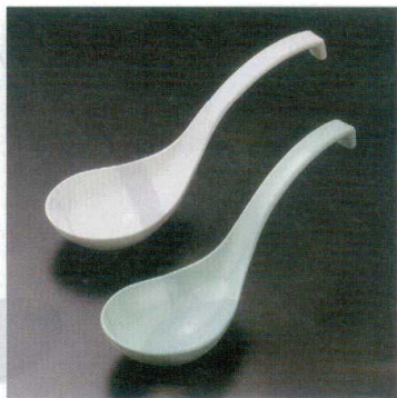
7-1093-20 (60001300) ジャンボラーメンレンゲ アイボリーOM ¥500 198×65 AC 7-1093-21 (60001790) ジャンボラーメンレンゲ 青磁OM ¥500