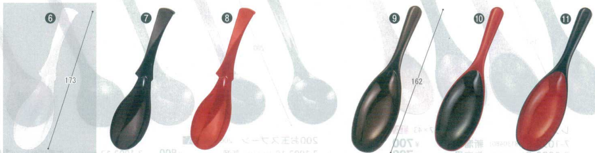
7-1093-6 (12010310) ツーウェイレンゲ 白 ¥350 173×44 AC 7-1093-7 (12010320) ツーウェイレンゲ 黒 ¥350 7-1093-8 (12010330) なすレンゲ 赤 ¥350 7-1093-9 (48130490) なすレンゲ 新溜 ¥680 162×42 A 7-1093-10 (48140850) なすレンゲ 朱内黒 ¥680 7-1093-11 (48140840) なすレンゲ 黒内朱 ¥680