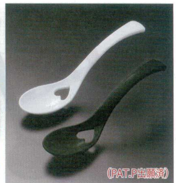
7-1093-22 (60001800) ハートホールレンゲ アイボリーOM ¥450 7-1093-23 (60001810) ハートホールレンゲ 黒OM ¥450