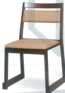
7-1171-2 (11035360) ¥61,000 千明高座椅子 桑染 (8198) 木 フレーム：ブラウン