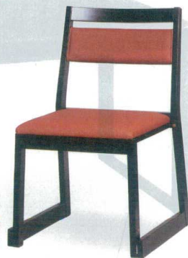
7-1171-3 (11035350) ¥61,000 千明高座椅子 弁柄 (8203) 木 フレーム：ブラック