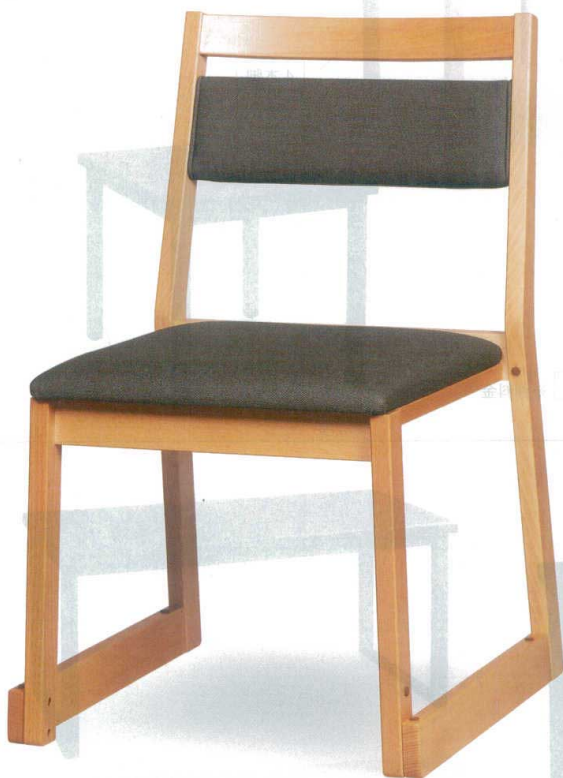
7-1171-1 (11035370) ¥61,000 千明高座椅子 石坂 (8201) 木 フレーム：ナチュラル