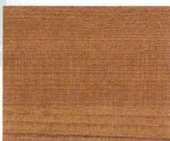
チーク柎目 (艶ナシ)