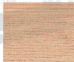
アッシュ柎目 (艶ナシ)