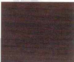
オーク柎目 (茶) (艶ナシ)