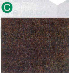
木もれび・金 (艶アリ)

※ PFU (Plaque-forming unit) プラーク法により測定したウイルス粒子数の指標 【注意事項】本製品は表面に付着した特定のウイルスの数を減少させますが、感染予防を保証するものではありません。また、抗ウイルス加工は病気の治療や予防を目的とするものではありません。