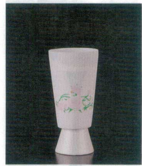
直運 7-1315-4 陶 ¥6,100 PSGタンブラー小(CBW-2) パラ(化粧箱入) φ55×114(140ml) (90035380)