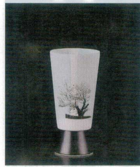
(SF-W) 陶器八角器脚 スマタリ 直運 7-1315-3 陶 ¥5,950 PSGタンブラー小(CS-2) 満開桜(化粧箱入) φ55×114(140ml) (90035370)