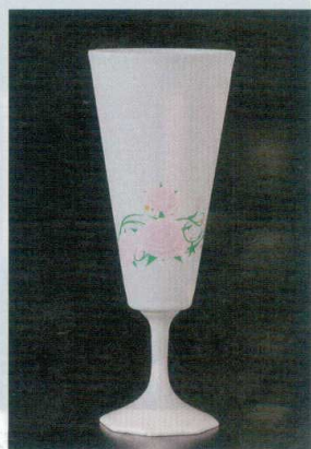
直運 7-1315-6 陶 ¥7,950 PSGピルスナー八角脚(CBW-5) パラ(化粧箱入) φ82×210(365ml) (90035320)