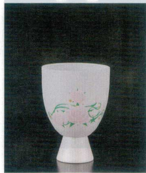
(SF-8) 陶器八角器脚 スマタリ 直運 7-1315-2 陶 ¥6,250 PSGゴブレット(CBW-4) パラ(化粧箱入) φ78×108(280ml) (90035360)