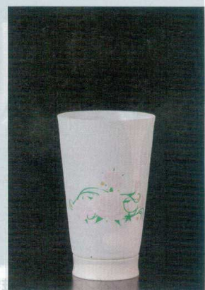
直運 7-1315-8 陶 ¥7,400 PSGタンブラー大(CBW-1) パラ(化粧箱入) φ80×133(390ml) (90035340)