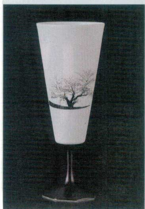
直運 7-1315-5 陶 ¥7,800 PSGピルスナー八角脚(CS5) 満開桜(化粧箱入) φ82×210(365ml) (90035310)