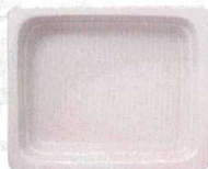
●ホワイト (浅)C-13 (深)D-18