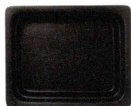
●ブラック (浅)C-11 (深)D-16