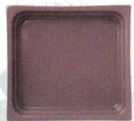
●チェスナッツブラウン (浅)E-29 (深)F-34