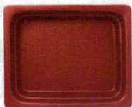
●レッド (浅)C-12 (深)D-17