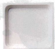
●ホワイト (浅)E-27 (深)F-32