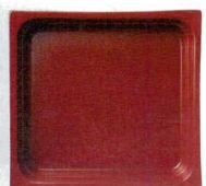
●レッド (浅)E-26 (深)F-31