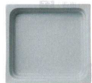
●ピタヤグレー (浅)E-28 (深)F-33