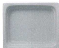
●ピタヤグレー (浅)C-14 (深)D-19