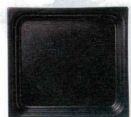
●ブラック (浅)E-25 (深)F-30