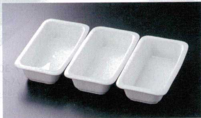
7-304-5 (70020820) ¥14,700 1/3ガストロノーム角(1ケ) (直運) 陶 338×180×75