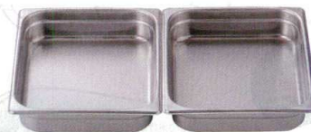
7-304-2 (70020855) ¥8,200 1/2角型フードパン(セット) (直運) ST 325×265×65