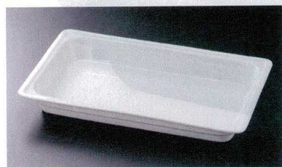
7-304-6 (70020940) ¥22,000 1/1ガストロノーム角 (直運) 陶 530×325×65