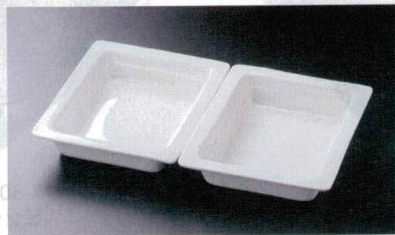
7-304-7 (70020950) ¥8,600 1/2ガストロノーム角(1ケ) (直運) 陶 325×265×65