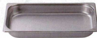
7-304-1 (70020845) ¥10,000 1/1角型フードパン (直運) ST 530×325×65