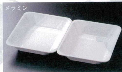
フードパン角(1ケ) 白 (直運) 防汚 7-304-9 (70020220) 2/3 ¥10,300 354×329×65 7-304-10 (70020230) 1/3 ¥7,200 329×176×65