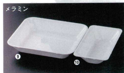
7-304-8 (70020320) ¥10,400 1/1フードパン角 (直運) 防汚 530×332×62