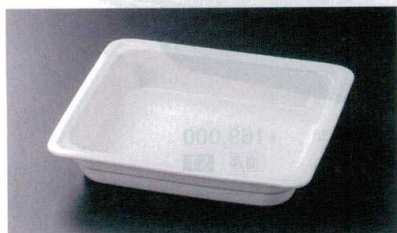
7-304-4 (70020810) ¥17,000 2/3ガストロノーム角 (直運) 陶 354×325×65