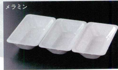
7-304-11 (70020340) ¥5,500 1/2フードパン角(1ケ)白 (直運) 防汚 329×265×65