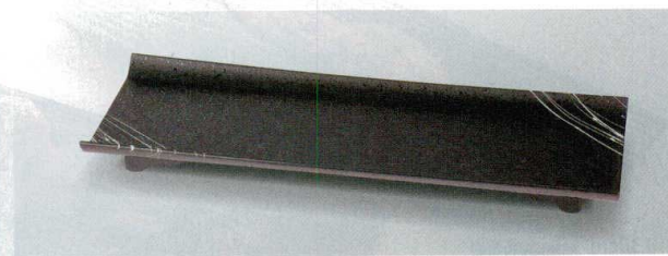
7-482-6 (50025675) ¥4,600 黒タタキ白乱糸 L型足付 TA