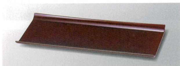
7-482-3 (45015060) ¥3,400 溜SH塗 TA