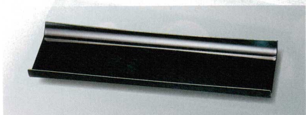
7-482-1 (50261595) ¥2,200 総黒 TA