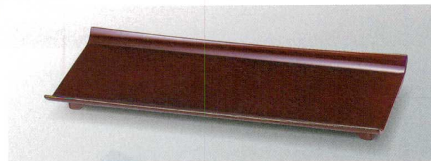
7-482-4 (45015065) ¥4,500 溜SH塗 L型足付 TA