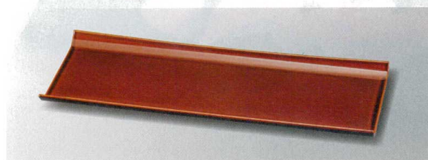
7-482-7 (51272136) ¥4,300 漆調春慶塗 TA