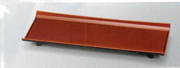
7-482-8 (51272135) ¥5,300 漆調春慶塗 L型足付 TA