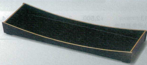
7-493-9 (55001170) ¥1,150 黒天金 A