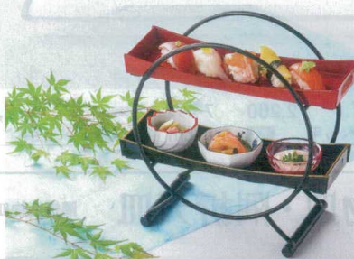
7-493-11 (90042020) ¥10,500 27cm丸型スタンド(黒) ST