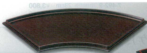
7-493-7 (55002450) ¥2,050 溜瀾黒裏黒天朱 A