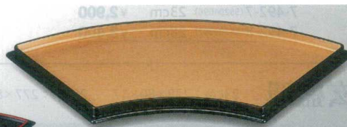
7-493-8 (51272148) ¥2,450 金パール溜瀾黒裏黒天朱 A