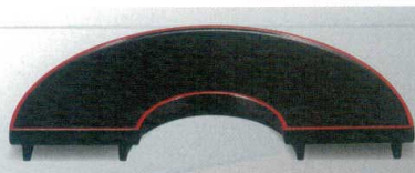
7-493-4 (50028765) ¥3,400 黒天朱 M