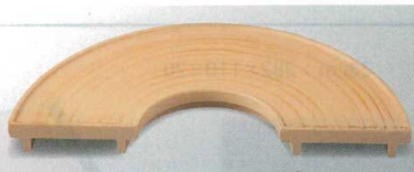
7-493-5 (55204147) ¥3,800 クリーム刷毛目 M