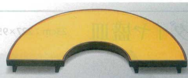
7-493-6 (51015820) ¥4,350 金粉蒔き裏黒塗 M