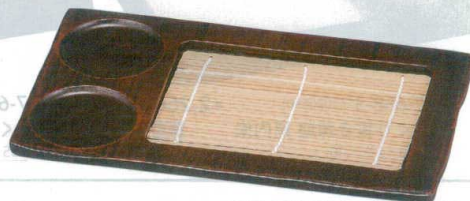
荒彫くり抜正角ざる (小) 柄塗

7-659-7 (45000670) 木 本体 ¥10,000 280×200×16 7-659-8 (49930020) 竹 正角竹ス ¥400 157×155