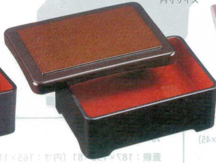
7-701-2 (42012400) ¥3,150 網代内朱 A