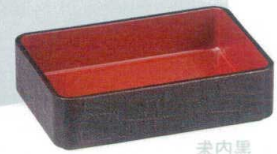
7-701-14 (40430177) ¥3,800 真漆刻塗り内朱 (中子) A