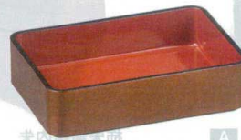
7-701-13 (40430167) ¥1,700 梨地内朱 (中子) A