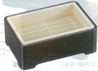
7-701-5 (45158150) ¥550 長角竹ス 竹 166×105 7-701-6 (45158140) ¥3,500 天井重用木枠 木 182×121×43