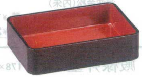
7-701-10 (40430157) ¥1,800 溜内朱 (中子) A