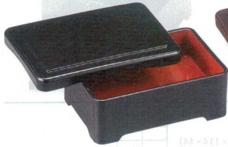
7-701-1 (40430500) ¥3,000 黒内朱 A