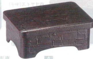
7-701-12 (40430170) ¥8,600 真漆刻塗り内朱 A