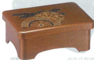
7-701-11 (40430160) ¥3,650 梨地御所車内朱 A