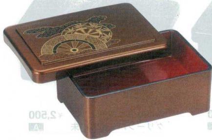
7-701-3 (45151440) ¥3,500 梨地御所車内朱 A