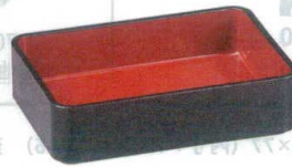
7-701-9 (40430147) ¥1,500 黒内朱 (中子) A