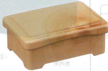
7-701-4 (42012590) ¥3,900 香林内朱 A