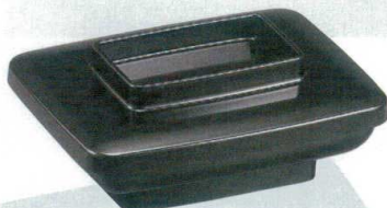
7-705-7 (40430330) ¥2,600 和うなぎ平 黒(内朱) 166×130×65