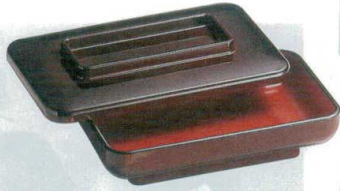
7-705-2 (41010010) ¥1,100 御殿型ミニうなぎ平 溜(内朱) 138×86×44