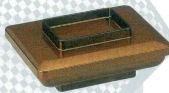
7-705-5 (41060210) ¥2,250 福うなぎ平 梨地天黒内朱 163×127×65