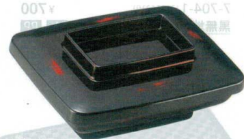
7-705-9 (41210120) ¥2,700 和うなぎ平 曙(内朱) 166×130×65