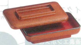
7-705-3 (41010020) ¥1,200 御殿型ミニうなぎ平 梨子地(内朱) 138×86×44