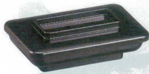
7-705-1 (40430300) ¥1,050 御殿型ミニうなぎ平 黒(内朱) 138×86×44