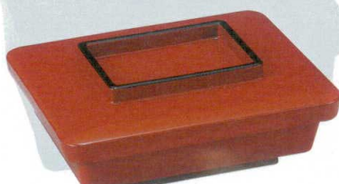
7-705-14 (41030410) ¥2,500 うなぎ平大 朱天黒内朱 185×155×70