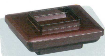
7-705-6 (40430320) ¥2,300 福うなぎ平 溜パール内朱 163×127×65