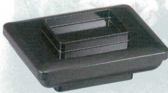
7-705-4 (40430310) ¥2,000 福うなぎ平 黒内朱 163×127×65