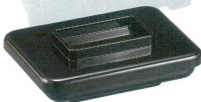
7-705-10 (40430340) ¥2,700 新うなぎ平 黒内朱 189×141×59