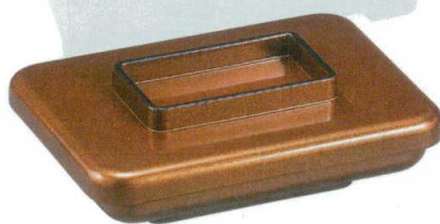
7-705-11 (40430350) ¥2,800 新うなぎ平 梨地内朱 189×141×59