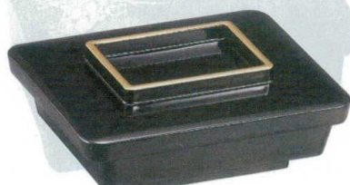
7-705-13 (40430360) ¥2,300 うなぎ平大 黒天金内朱 185×155×70