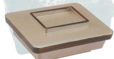
7-705-15 (40420720) ¥5,500 うなぎ平大 銀淵べっ甲内朱 185×155×70