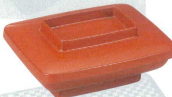
7-705-8 (45151560) ¥2,600 和うなぎ平 柿朱(内朱) 166×130×65