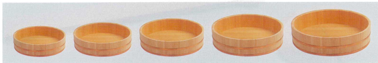
飯切 直運 木 7-881-19 (78250710) 尺2 ¥14,500 φ360×90 7-881-20 (78250720) 尺3 ¥16,500 φ390×97 7-881-21 (78250730) 尺4 ¥18,000 φ420×105 7-881-22 (78250740) 尺5 ¥27,000 φ450×110 7-881-23 (78250750) 尺6 ¥34,000 φ480×115 7-881-24 (78250760) 尺8 ¥48,000 φ540×145 7-881-25 (78250770) 2尺 ¥58,000 φ600×160 7-881-26 (78250780) 2尺2寸 ¥70,000 φ660×170 7-881-27 (78250790) 2尺5寸 ¥81,500 φ750×175