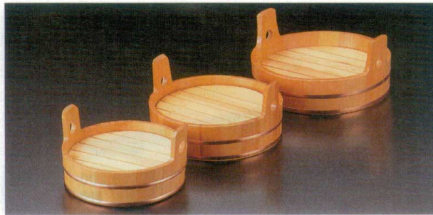
両手桶盛込器(目皿付) 直運 木 7-881-10 (53250610) 8寸 ¥25,000 φ240×130 7-881-11 (53250620) 9寸 ¥27,000 φ270×130 7-881-12 (53250630) 尺0 ¥29,800 φ305×140