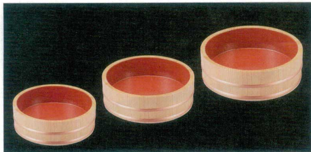
盛込桶 内朱 直運 木 7-881-7 (40431530) 7寸 ¥12,000 φ210×70 7-881-8 (40431540) 8寸 ¥13,000 φ240×85 7-881-9 (40431550) 9寸 ¥14,500 φ270×90