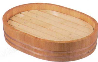
小判桶盛込器(目皿付) 直運 木 7-881-13 (53250810) 尺3 ¥35,000 400×300×80 7-881-14 (53250820) 尺5 ¥41,000 460×360×95 7-881-15 (53250830) 尺6 ¥45,500 480×390×95