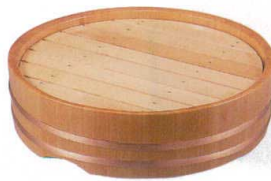
丸桶盛込器(目皿付) 直運 木 7-881-16 (53250710) 尺0 ¥22,000 φ305×80 7-881-17 (53250720) 尺1 ¥25,500 φ330×85 7-881-18 (53250730) 尺2 ¥29,000 φ365×80