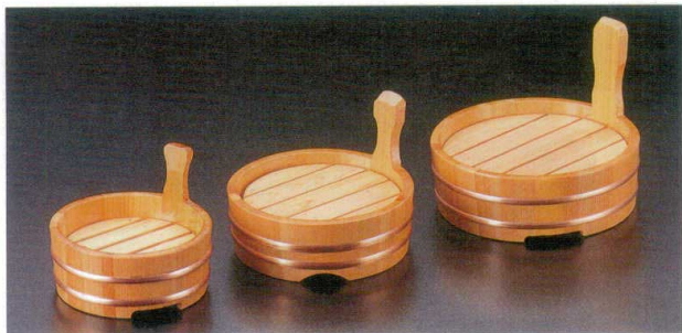
片手桶盛込器(目皿付) 直運 木 7-881-1 (53691240) 5寸 ¥13,200 φ150×56 7-881-2 (53691250) 6寸 ¥16,200 φ180×65 7-881-3 (53691260) 7寸 ¥17,300 φ210×65