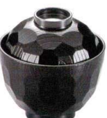
耐 A5726-761 総黒32亀甲小吸椀 850円 (9.4×9.8cm・220cc)A・ウ