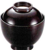
耐 A5720-761 溜31福丸小吸椀 1,800円 (9.1×9.3cm・195cc)TA・ウ・耐