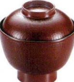
耐 A5723-761 茜朱千筋楽椀 1,500円 (10.2×10.2cm・235cc)A・ウ