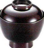
耐 A5722-761 溜夢楽椀 1,700円 (10.3×10.2cm・235cc)A・ウ