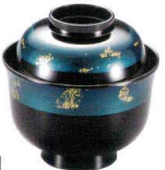
耐 A5712-761 青金箔帯33千鳥小吸椀 2,950円 (9.7×9.8cm・200cc)TA・HC・耐