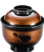
耐 A5709-761 白檀瓢箪33乱筋小吸椀 2,650円 (10×9.8cm・220cc)TA・硬・耐