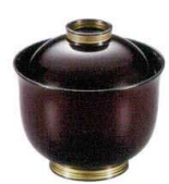
耐 A5704-761 溜金冠30リボン椀 2,800円 (8.6×8.8cm・185cc)木合・硬・耐