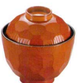
耐 A5725-761 春慶32亀甲小吸椀 950円 (9.4×9.8cm・220cc)A・ウ