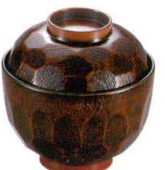
耐 A5724-761 板塗32亀甲小吸椀 1,100円 (9.4×9.8cm・220cc)A・ウ