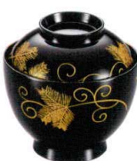
耐 A5708-761 唐草32小吸椀 2,900円 (9.7×10cm・245cc)TA・硬・耐