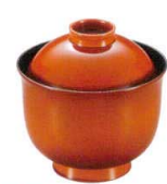
耐 A5705-761 春慶30リボン椀 2,500円 (8.6×8.8cm・185cc)木合・ウ・耐