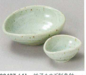
02437-641 益子たまご刺身鉢 2,000円 (17×14×6cm) 02438-641 益子たまご千代久 800円 (10×8×4.2cm)