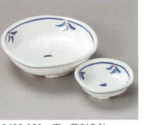
02423-131 青い花刺身鉢 1,970円 (15×4.5cm) 02424-131 青い花千代口 900円 (9×3.2cm)