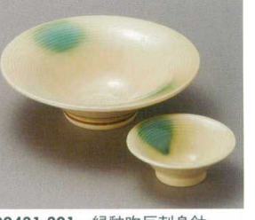
02431-321 緑釉吹反刺身鉢 1,900円 (14.7×4.4cm) 02432-321 緑釉吹反千代久 880円 (7.6×2.8cm)