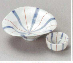
02413-521 十草朱線なぶり向付 2,300円 (15.6×5.4cm) 02414-521 十草朱線丸千代口 1,250円 (6.2×3cm)