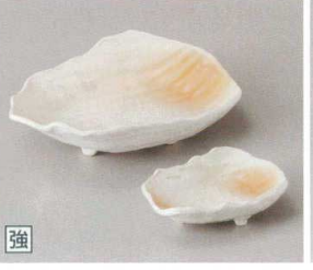
02405-321 あげぼの岩型向付 2,080円 (19.5×14×4.5cm) 02406-321 あげぼの岩型小付 820円 (11×8×3cm)