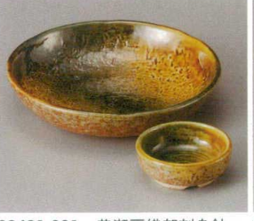
02421-321 黄瀬戸織部刺身鉢 2,280円 (16.4×3.4cm) 02422-321 黄瀬戸織部千代口 950円 (6.7×2.5cm)