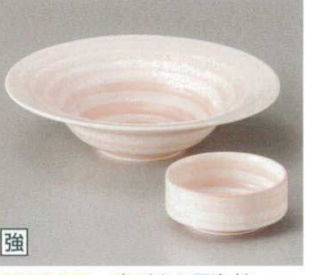
02415-121 春がすみ反向付 2,000円 (16.3×3.8cm) 02416-121 春がすみ丸千代口 960円 (6.7×2.8cm)