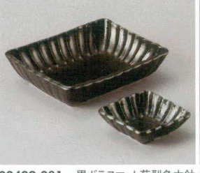
02429-281 黒ガラスマット菊型角中鉢 1,900円 (19×14.5×5cm) 02430-281 黒ガラスマット菊型角小付 800円 (9×9×3.5cm)