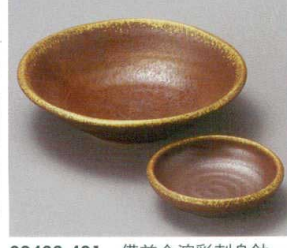
02433-401 備前金溶彩刺身鉢 1,900円 (14.7×3.8cm) 02434-401 備前金溶彩千代口 1,150円 (8.3×2.3cm)