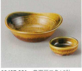
02427-321 黄瀬戸三角4.5鉢 1,900円 (14.5×14.5×4.1cm) 02428-321 黄瀬戸丸千代口 820円 (7×2.8cm)