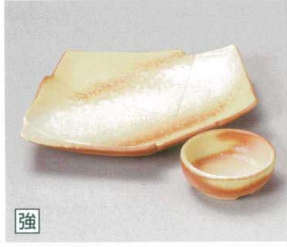
02401-191 春結晶結び皿 2,100円 (21.2×14.7×2.8cm) 02402-191 春結晶三ッ足丸千代口 890円 (7×2.5cm)