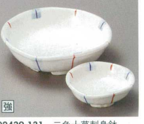
02439-131 二色十草刺身鉢 1,860円 (15×4.5cm) 02440-131 二色十草千代久 840円 (9×3.2cm)