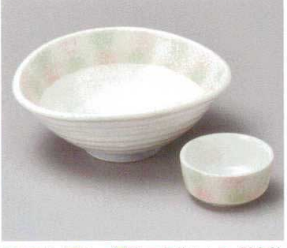
02411-181 平成二色吹たわみ 刺身鉢 2,050円 (15.2×13.8×6cm) 02412-181 平成二色吹 丸千代口 870円 (6.2×3cm)