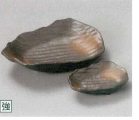
02407-131 火色岩型刺身鉢 2,050円 (19.5×14×4.5cm) 02408-131 火色岩型千代口 810円 (11×8×3cm)