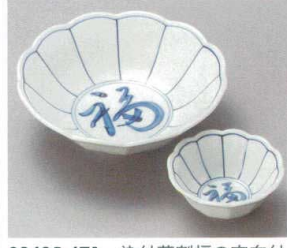
02425-471 染付菊割福の字向付 1,950円 (15×5cm) 02426-471 染付菊割福の字千代口 1,100円 (8×3cm)