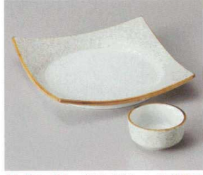
02409-181 瀏サビグリーン吹前菜皿 2,080円 (17×17cm) 02410-181 瀏サビグリーン吹丸千代口 760円 (6.5×3cm)