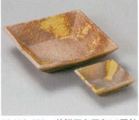
02419-491 美膳正角正角5.0平鉢 1,980円 (16.5×16.5×4.5cm) 02420-491 美膳正角正角千代久 750円 (8.3×8.3×2.8cm)