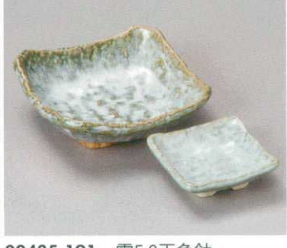
02435-191 霞5.0正角鉢 1,900円 (14×14×4.8cm) 02436-191 霞正角小皿 700円 (8.2×8.2×2.5cm)