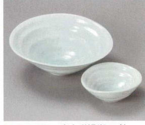
02417-491 青白磁渦潮5.0鉢 1,980円 (16×14.5×5.5cm) 02418-491 青白磁渦潮千代久 700円 (9.2×8.4×3.5cm)