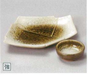
02403-191 織部かすみ結び皿 2,100円 (21.2×14.7×2.8cm) 02404-191 織部かすみ三ッ足丸千代口 890円 (7×2.5cm)