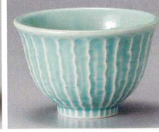
63322-161 トルコ青磁しのぎ飯碗 870円 (11.5×7.7cm)