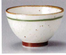
63314-471 わさび飯碗 900円 (11.6×7cm)