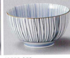
63329-251 細十草お好み丼 小 840円 (13.2×7.4cm)