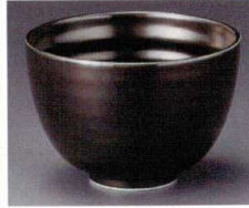
63312-181 黒釉多用小丼 980円 (12×8.3cm)