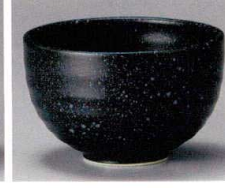
63327-641 黒銀いっぶく碗 850円 (10.5×6.6cm)