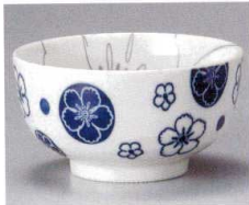
63301-601 ポピーズ青4.0多用丼 940円 (12.8×7cm)