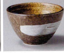
63323-241 羽手捻り姫丼 860円 (13.1×8.1cm)