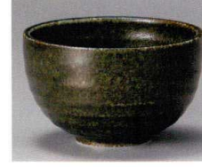
63326-641 窠変織部いっぶく碗 850円 (10.5×6.5cm)