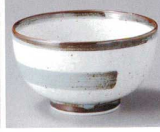
63319-281 雪見刷毛夏目4.0丼 880円 (13×7.7cm)