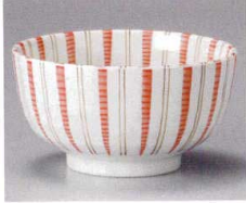
63303-601 千段十草赤4.0丼 940円 (12.8×7cm)