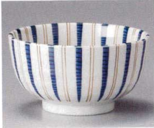
63302-601 千段十草青4.0丼 940円 (12.8×7cm)