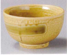
63304-281 イラボ織部夏目4.0丼 930円 (13×7.7cm)