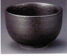
63310-101 利休天目4.0丼 950円 (13×8.2cm)