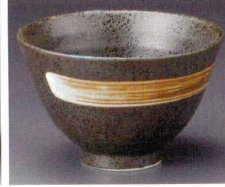
63317-121 白刷毛天目茶漬碗 880円 (12.8×8.8cm)