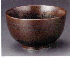
63309-161 錆ウズ4.0丼 920円 (12.7×7.6cm)