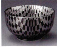
63308-161 市松 黒4.1多用丼 920円 (12.8×7cm)