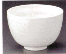
63311-181 白釉多用小丼 980円 (12×8.3cm)