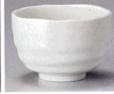
63318-511 淡雪京小丼 880円 (10.8×7.2cm)