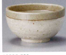
63325-591 白露4.2丼 850円 (13×7.5cm)