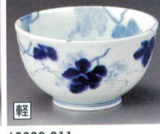
63330-011 藍染ぶどう4.5軽量丼 840円 (13.1×7.5cm)