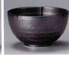
63328-511 南蛮吹流し4.0丼 840円 (12.2×7.1cm)