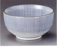
63305-161 千段十草4.1多用丼 920円 (12.8×7cm)