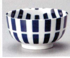
63313-641 リビートお好み丼 900円 (13×7cm・500cc)