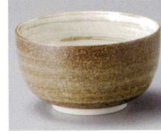
63321-051 旋風(黒)多用碗(小) 880円 (13×7.2cm)