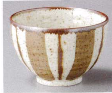
63306-181 錆十草茶漬丼 1,000円 (12×8cm)