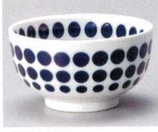
63315-641 ラウンドお好み丼 900円 (13×7cm・500cc)