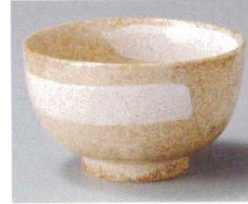
63316-281 茶粉引刷毛夏目4.0丼 880円 (12.8×7.7cm)