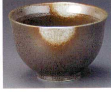
63320-051 白吹天目反多用碗(小) 880円 (11.5×7.3cm)