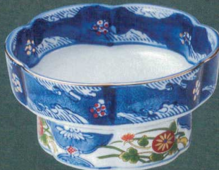
412-6-557 4.2小鉢 3,300円 13×6.5cm 52905551