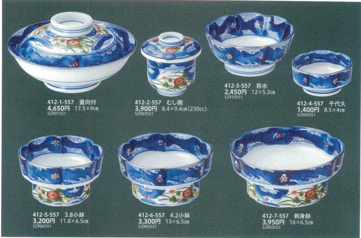
412-1-557 蓋向付 4,650円 17.5×9cm 52901551