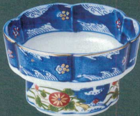
412-5-557 3.8小鉢 3,200円 11.8×6.5cm 52906551