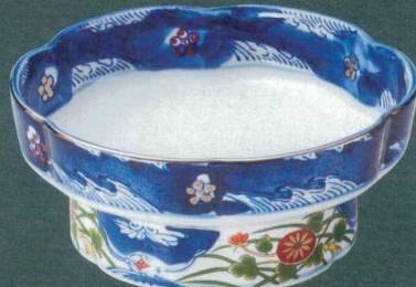
412-7-557 刺身鉢 3,950円 16×6.5cm 52903551