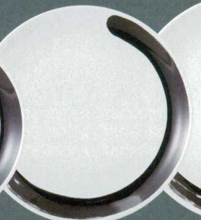
527-23-227 10吋皿 2,180円 25.7×2.5cm 30入 71473225