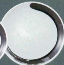
527-21-227 7 1/2皿 1,150円 19×2.2cm 50入 71471225