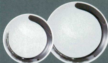
527-20-227 6 1/2皿 1,100円 16.3×2.2cm 60入 71470225