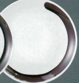
527-24-227 11吋皿 2,750円 28.1×2.8cm 20入 71474225