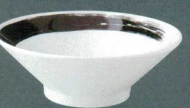
527-8-227 高浜反7.0丼 2,700円 21.3×8.7cm 30入 71458225