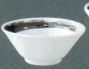
527-14-227 4.8ライス 1,260円 14.7×6.2cm 60入 71464225