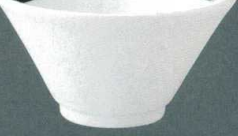
527-17-227 深口反6.3丼 2,500円 18.8×10.2cm 30入 71467225