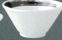
527-15-227 深口反5.5丼 2,100円 16.8×8.8cm 50入 71465225