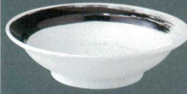
527-13-227 7寸丸高台 2,100円 21.7×5.8cm 30入 71463225