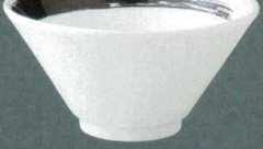
527-16-227 深口反6.0丼 2,300円 18×9.2cm 40入 71466225