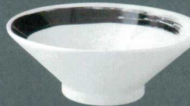
527-6-227 高浜反8.0丼 4,000円 25.2×9.6cm 20入 71456225