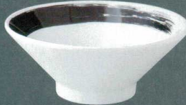
527-5-227 高浜反7.5丼 3,200円 23.8×8.8cm 30入 71455225