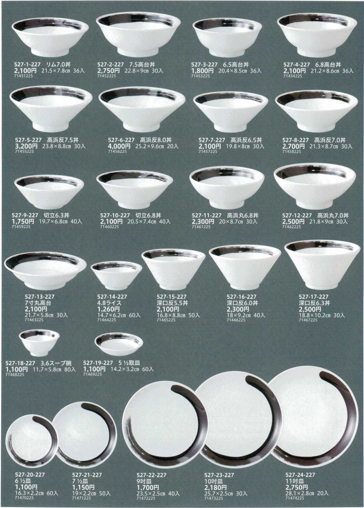
527-1-227 リム7.0丼 2,100円 21.5×7.8cm 36入 71451225