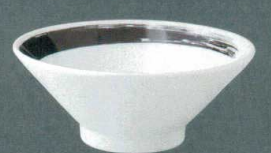
527-7-227 高浜反6.5丼 2,100円 19.8×8cm 30入 71457225